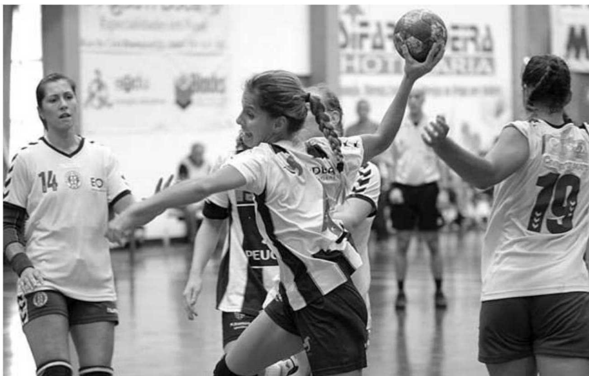
O Madeira Andebol SAD e Sports estiveram bem na entrada do campeonato