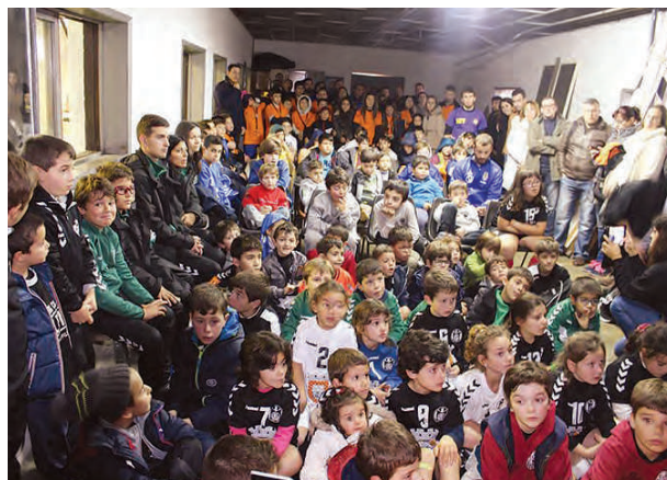
O “Monte’s Bambis” juntou mais de 100 jovens