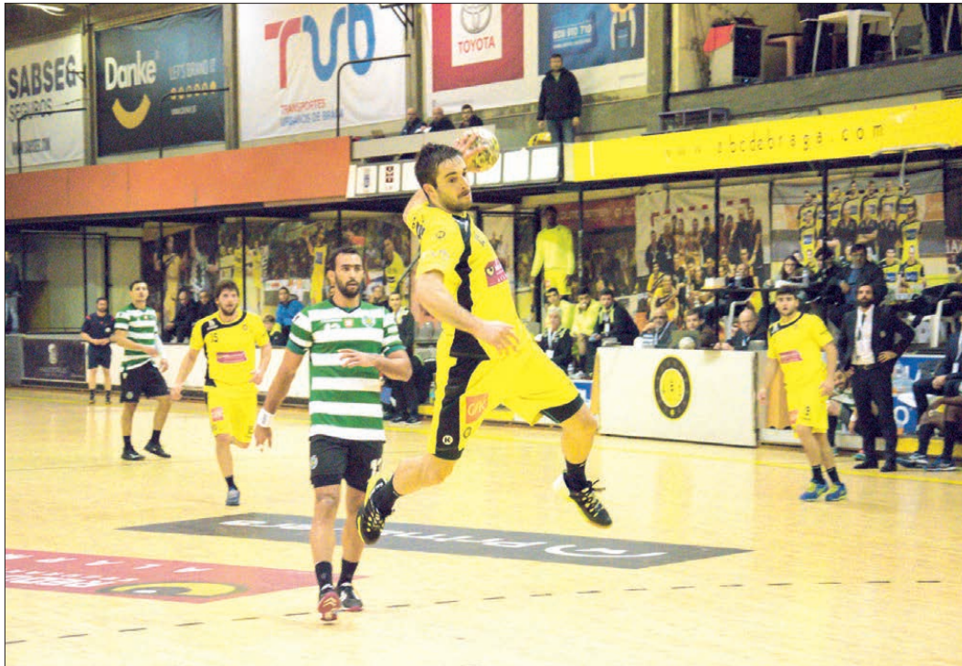
ABC caiu na reta final da partida