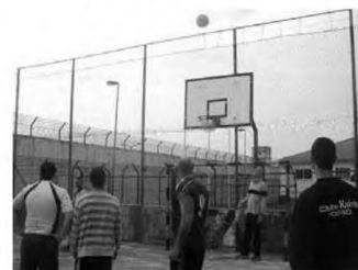
Desporto no Estabelecimento Prisional

Numa ação conjunta do Espaço FREE - Kairós e do Clube K, iniciou-se em Novembro de 2015 um projeto de intervenção desportiva junto do cidadão que se encontra no EP de Ponta Delgada, que visa não só contribuir para o seu bem-estar, combatendo o sedentarismo, prevenindo o comportamento aditivo e a obesidade, mas também promover relações sociais positivas. Um dos elementos diferenciadores deste projeto é envolver, desde cedo o cidadão recluso na organização deste projeto, motivando-o a integrar uma prática desportiva. Para o efeito, iniciaram-se já um conjunto de sessões informativas/demonstrativas de Voleibol, Basquetebol, Andebol e Futsal que abrangeram 83 participantes. Em breve