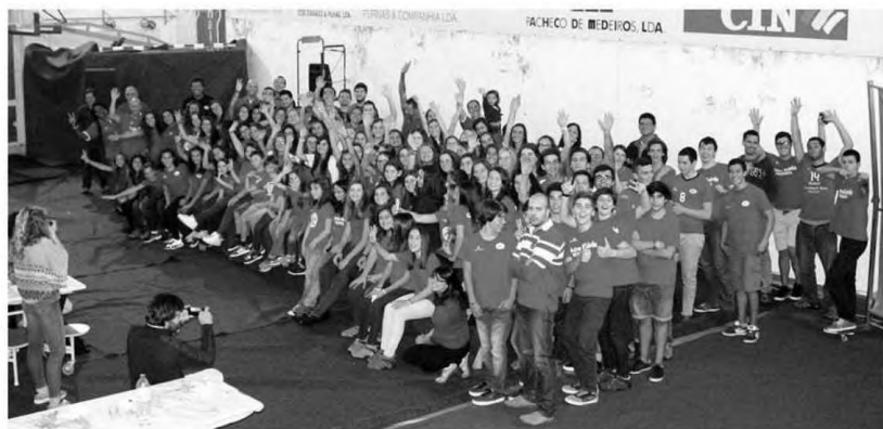
Crianças e jovens do Clube K - Voleibol

O Clube K promove o seu trabalho acreditando que a prática desportiva é um dos veículos para a inclusão social de crianças e jovens