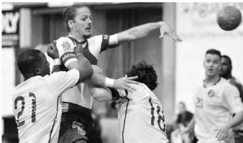
Pavilhão do Funchal encheu-se para mais uma festa do andebol.

Na segunda parte os madeirenses foram soberbos e à passagem do minuto 34 passavam para a frente do marcador (14-13), conseguindo