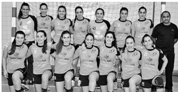
Equipa de juniores da Didáxis

As iniciadas deslocaram-se a casa do vizinho AC Vermoim para o duelo famalicense, garantindo triunfo por 14-11 num jogo que contou com a presença de muito público nas bancadas. No final da primeira parte a equipa da Didáxis já se encontrava na frente do marcador por 5 golos, no entanto fruto de uma segunda parte de menor acerto ofensivo, o AC Vermoim aproximou-se do marcador e manteve expectativa