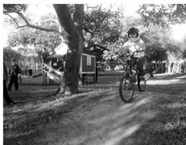
BTT na Quinta do Priôlo

O Clube K cria departamento de ciclismo em Novembro de 2015, dando forma à atividade que vinha já desenvolvendo com uma pista para os mais novos situada na Quinta do Priôlo e que sempre despertou muito interesse e entusiasmo junto dos mais novos. É uma modalidade que potencia a resistência, a velocidade, a agilidade, a coordenação e o equilíbrio, assim como promove a consciência ecológica e cria hábitos de vida saudáveis, aumentando a capacidade respiratória e favorecendo o sistema circulatório. Estimula o desenvolvimento dos valores sociais, como o companheirismo, o respeito e a solidariedade, para os que a encaram como lazer, mas também, apela a um espírito de superação, segurança e confiança para os que