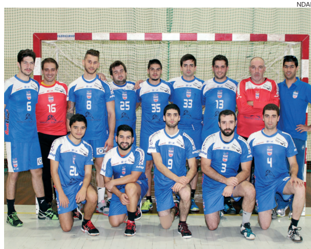
NDA Pombal perdeu na deslocação a Samora Correia

Já as seniores femininas tinham um confronto com um adversário directo na luta pelos lugares de acesso à fase final da II Divisão Nacional e acabaram por se deixar surpreender pelo Valongo do Vouga, perdendo por 22-25, depois de uma má prestação, principal-