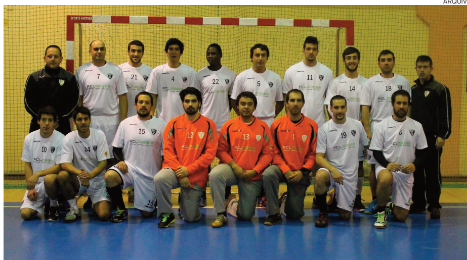
Viseenses ocupam agora o penúltimo lugar da classificação

Seria, talvez, boa a experiência a experiência das equipas