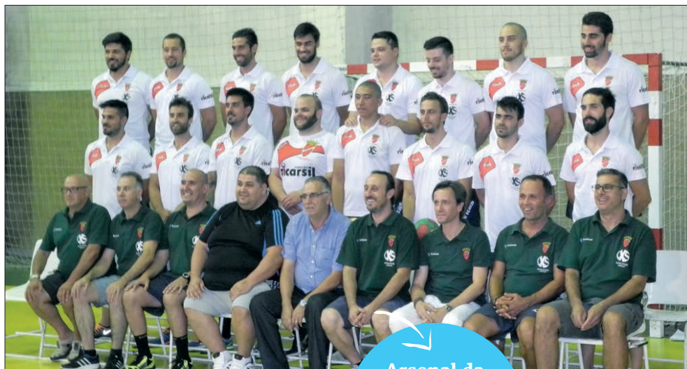
Plantel do Arsenal da Devesa para 2016/17

Arsenal da Devesa vai continuar a disputar os seus jogos no Sá Leite