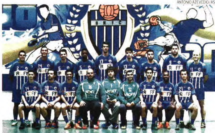
Clube gostava de festejar o centenário no campeonato maior do andebol nacional