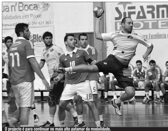
O projecto é para continuar no mais alto patamar da modalidade.

Novidade são as viagens pagas pelos clubes. Uma realidade diferente para os clubes que virão jogar à Madeira, já para a próxima época. De acordo com uma deliberação da Federação de Andebol de Portugal (FAP) foi «adoptado que os clubes e sociedades desportivas liquidem directamente as suas despesas re-