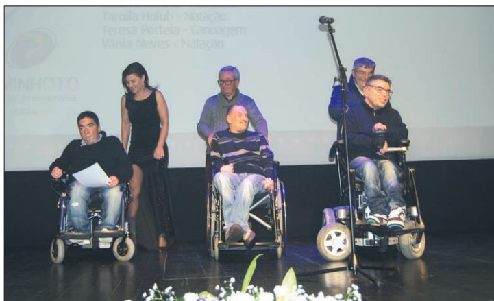
Atletas paralímpicos homenageados em Guimarães