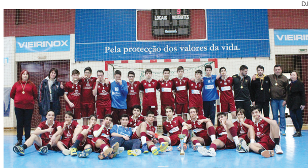
Jogadores e "staff" da equipa de Iniciados Masculinos

Na primeira fase do Campeonato Regional, o S. Bernardo disputou a sua série com as equipas "A" e "B" do Feirense e com a Sanjoanense. Se os "B" da Feira e a Sanjoanense foram bastante acessíveis, com vitórias de alguma facilidade para os "são-