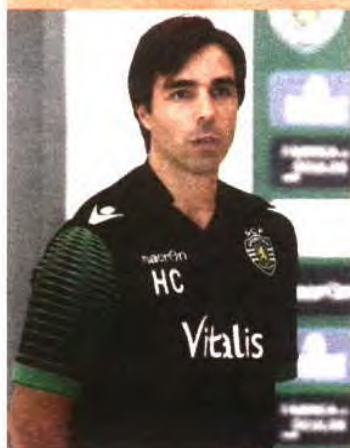
Hugo estreia-se no comando do Sporting

→ Adjunto de Zupo cumpre, hoje, o primeiro jogo nas novas funções de técnico do Sporting