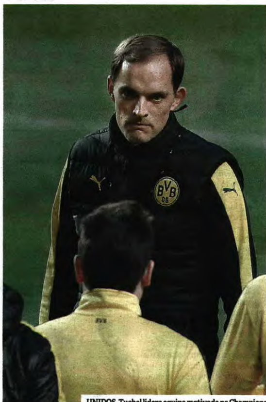
UNIDOS. Tuchel lidera equipa motivada na Champions

Ainda sobre o ataque, houve lugar a palavras especiais para a dupla do momento, composta por Jonas e Mitroglou. Tuchel conhece bem os danos que, juntos, estes dois jogadores podem causar: "Criam muitos desequilíbrios. É uma dupla muito forte. Mitroglou