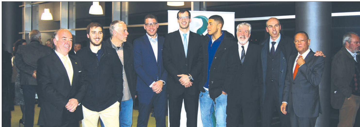
A comitiva do ABC na 20.ª edição d' "O Minhoto" Troféus Desportivos