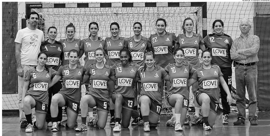
Equipa do Alavarium vai tentar conquistar a primeira Taça de Portugal