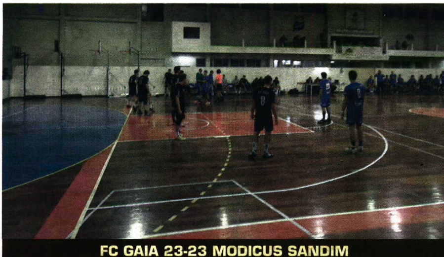
FC GAIA 23-23 MODICUS SANDIM