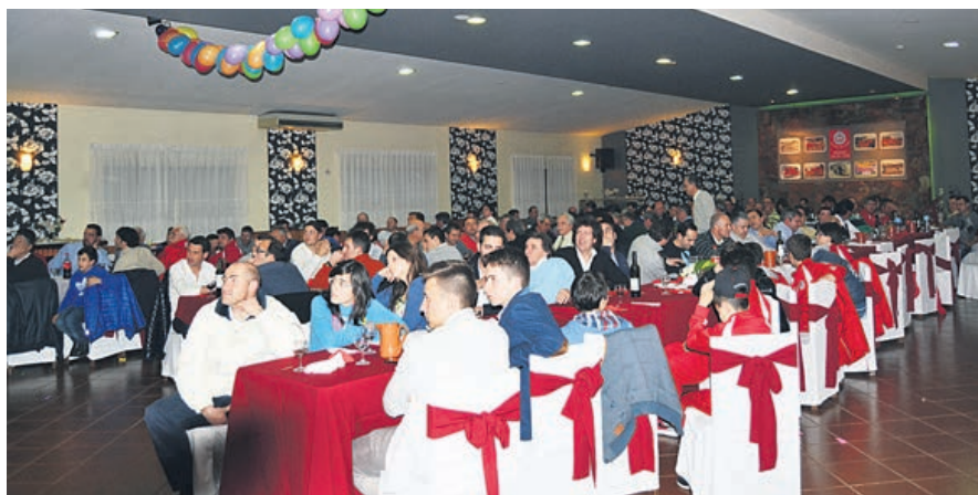
Momento do jantar-convívio, sábado à noite

CAMPO DO SOBREIRO e Pavilhão de Ferreiros acolheram torneios entre equipas de várias gerações do Ferreirense, no 56.º aniversário, cuja comemoração terminou com um jantar-convívio.