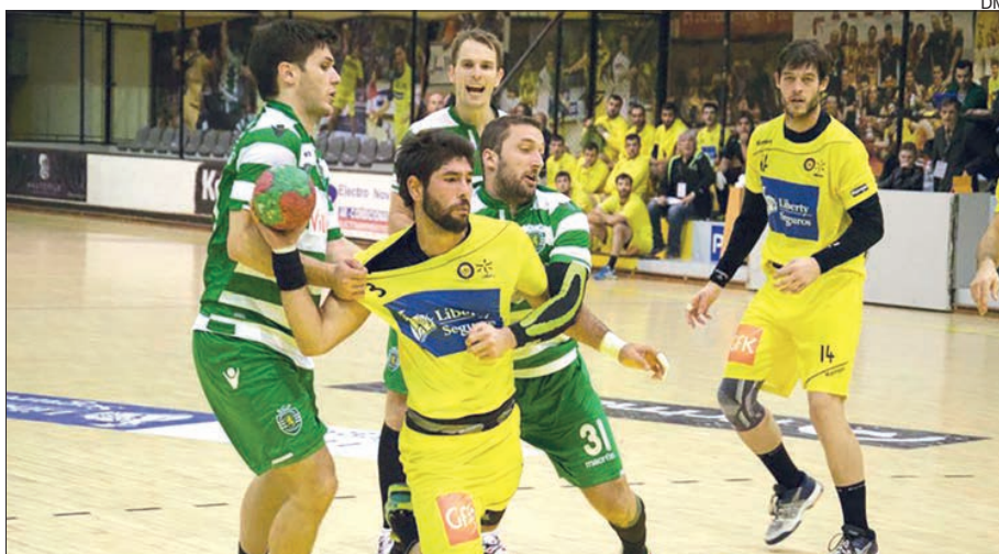
ABC/UMinho sem margem de manobra. Se perder com leões... é eliminado do "play-off"