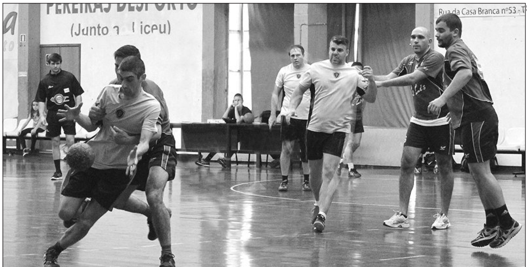
A equipa do Académico A venceu facilmente o Carvalheiro, na abertura do Campeonato de Veteranos.

Numa altura em que os escalões de formação do andebol madeirense se encontram em férias da Páscoa, iniciou-se o primeiro Campeonato Regional de Veteranos Masculinos.