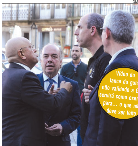
Presidente do ABC/UMinho indignado