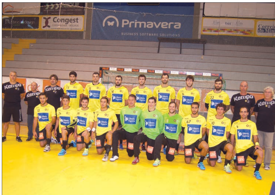
ABC/UMinho vai tentar hoje anular a desvantagem sofrida ontem

O ABC iniciou ontem com uma derrota as meias-finais dos 'play-offs' do campeonato nacional de andebol, ao perder em Odivelas, por 30-23, com o Sporting.