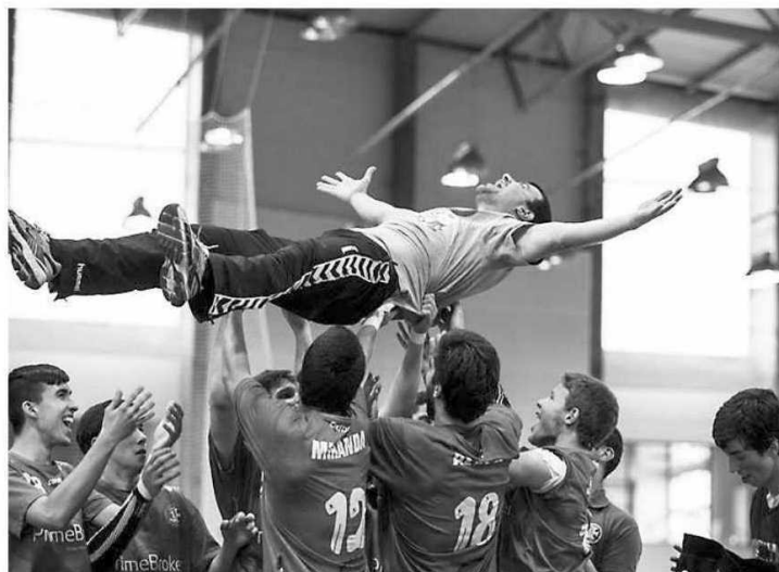
Equipa de juvenis da B. Perestrelo festeja o título.

Nos femininos, e em juvenis, as 'estudantes' estiveram igualmente na corrida pelo pódio, mas no jogo de 3.º e 4.º lugares viriam a perder diante do Bueu At. BM (Espanha) por 24-23. Nota ainda para os infantis femininos para o Madeira SAD que alcançou um brilhante quarto lugar. P. V. L.