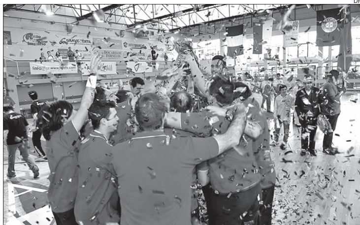
Seleção portuguesa festeja o primeiro título europeu da história do andebol INAS