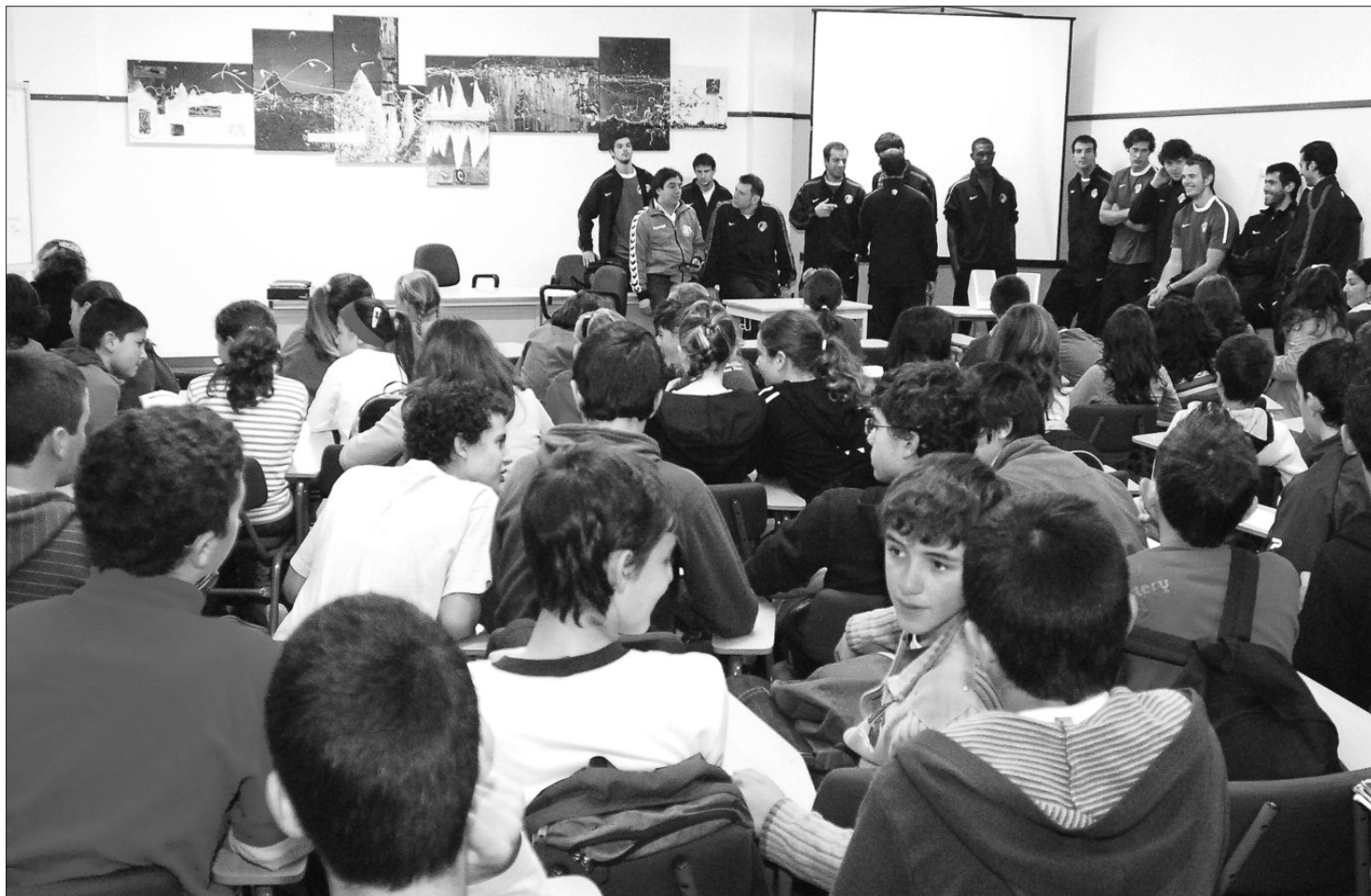
Manhã e início de tarde animado e movimentado na freguesia da Camacha. Os jovens trocaram impressões e aprenderam sobre a modalidade com os profissionais.