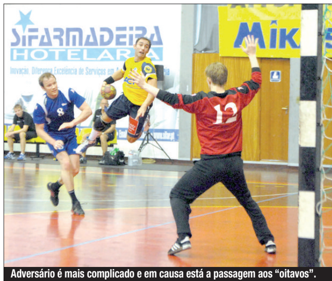
Adversário é mais complicado e em causa está a passagem aos “oitavos”.

O 1.º jogo decorre este mês no Funchal e a 2.ª “mão” está marcada para o início de Dezembro.