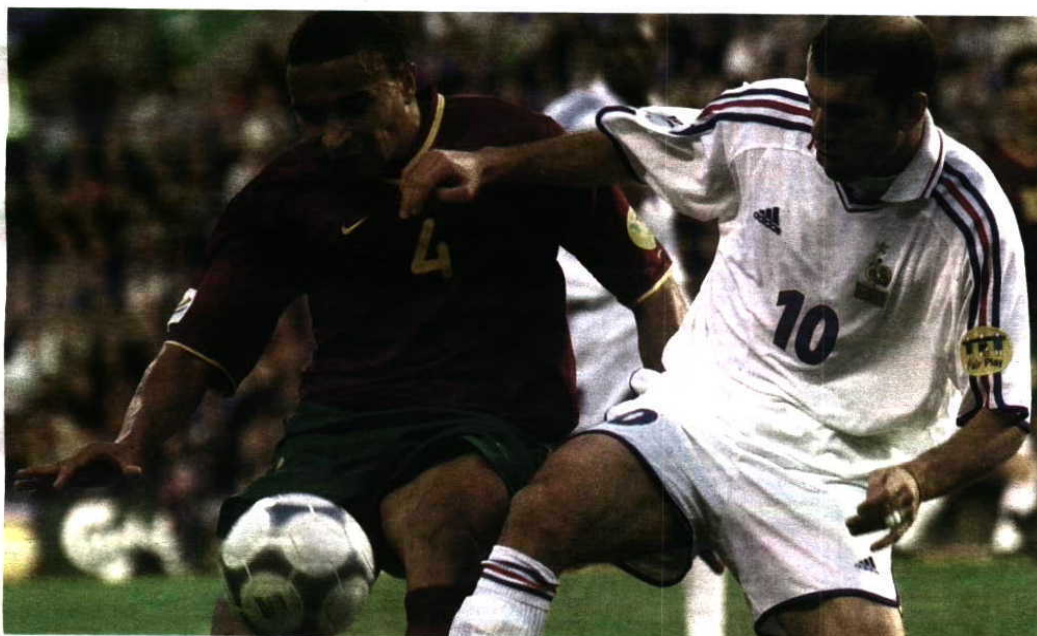
Vidigal (com Zidane no Euro-2000) é o último sportinguista nascido em Angola a jogar por Portugal