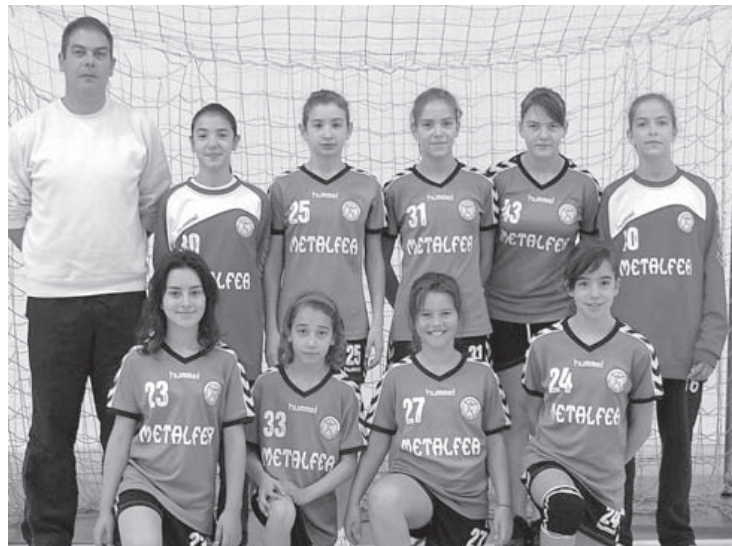
Infantis femininos do CD Pateira