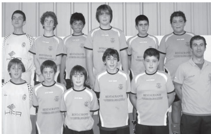
Infantis masculinos da Casa do Povo de Valongo do Vouga

Iniciados femininos – No próximo fim-de-semana, a equipa de iniciados femininos da CPVV regressa à competição (nacional da I divisão). Recebe o Porto Alto pelas 12 horas de sábado.