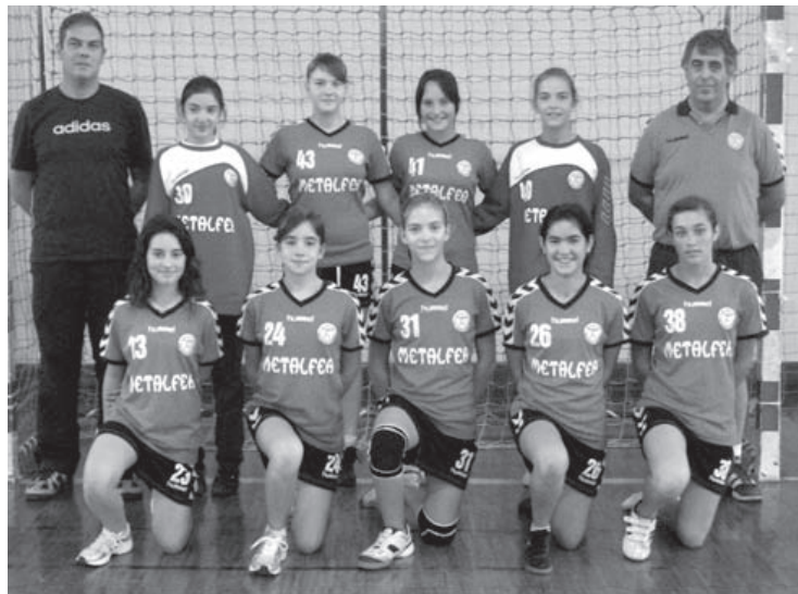
Iniciados femininos do CD Pateira

A equipa de juvenis femininos do CD Pateira regressa à competição no próximo domingo, igualmente em Aguada de Cima, defrontando a LAAC às 17 horas.