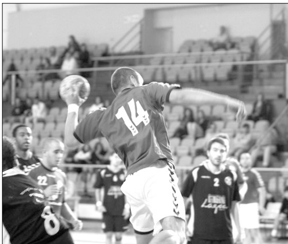
O Torreense bateu o Andebol Clube de Sines por 44-14, no último jogo

Menos bem nesta jornada esteve o Almada que perdeu com o Oriental (36-27), sofrendo assim a quarta derrota, e terceira consecutiva,