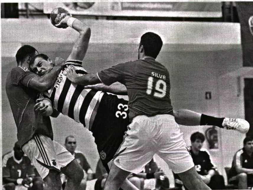
SEM TRÉGUAS. Encontro entre os eternos rivais no Torneio de Viseu foi equilibrado e emotivo

A solução encontrada com o pavilhão do Ginásio do Sul, clube que já fez parte do escalão maior, acabou por resolver um problema complicado, dado que a taxa de