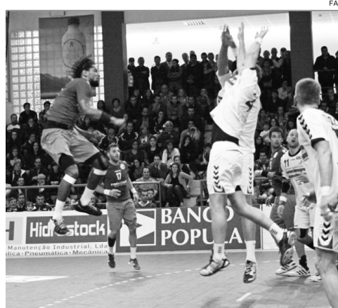
Andebol Apoio vindo das bancadas não foi suficiente

Portugal adiantou a defesa, voltou a reduzir a desvantagem para dois (24-26), mas Dude Ingars encarregou-se de esfriar o entusiasmo luso quando faltavam menos de dois minutos, pouco tempo