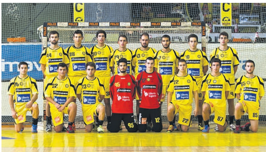
Equipa de juniores do ABC de Braga/UMinho

TRIUNFO SOBRE O XICO ANDEBOL , em Guimarães, permite ao ABC Braga/UMinho manter o comando do campeonato nacional de andebol de juniores da I Divisão, com mais dois pontos que o FC Porto.