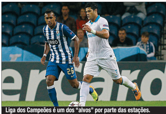
Liga dos Campeões é um dos "alvos" por parte das estações.

O Governo anunciou ontem que uma televisão em sinal aberto vai transmitir um jogo por jornada da I Liga 2014-2015, envolvendo uma das cinco equipas melhor classificadas, por se tratar de um evento de interesse público. A decisão, assinada pelo ministro Poiares Maduro, foi publicada em Diário da República, na lista de eventos de interesse generalizado que têm de ser emitidos por televisões generalistas de sinal aberto, ou seja, RTP, SIC ou TVI. Segundo o documento, os detentores dos direitos exclusivos terão de assegurar, até um mês an-