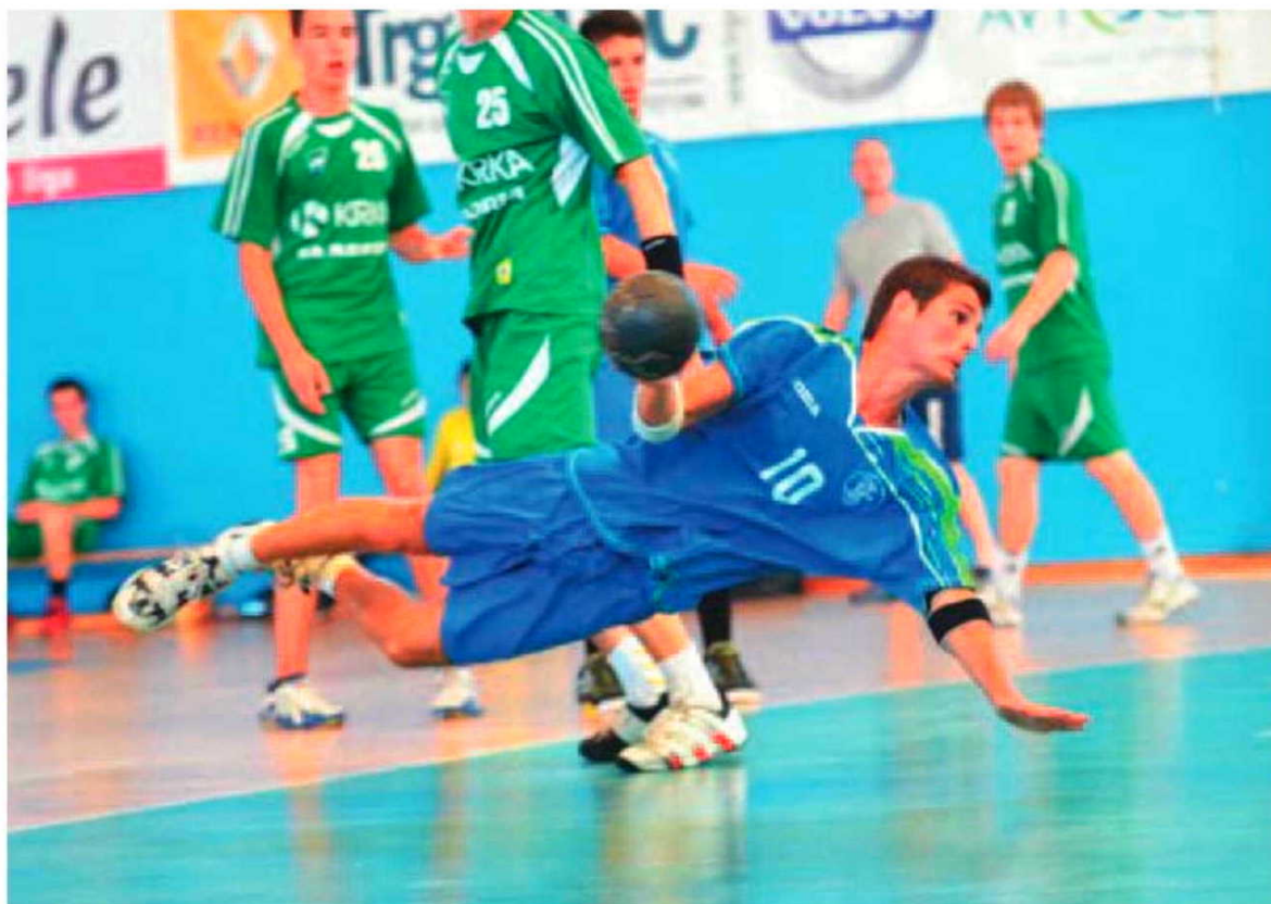
Os madeirenses deram espectáculo e surpreenderam.