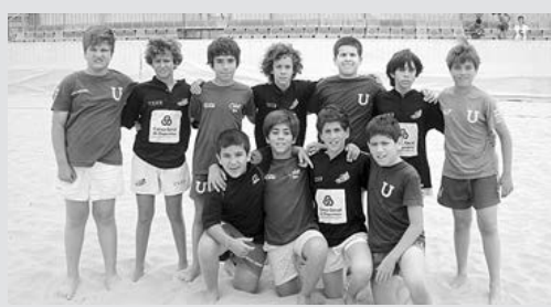
Jovens craques do Râguebi de Viana mostraram o seu valor

O Râguebi de Viana encontra-se a disputar, com três equipas (duas no escalão sub-14 e uma sub-12), no Circuito Beach-Rugby ARN/ FPR, tendo disputado, no passado fim-de-semana, em Matosinhos na primeira jornada da competição, tendo conseguido bons resultados apesar da sua inexperiência.