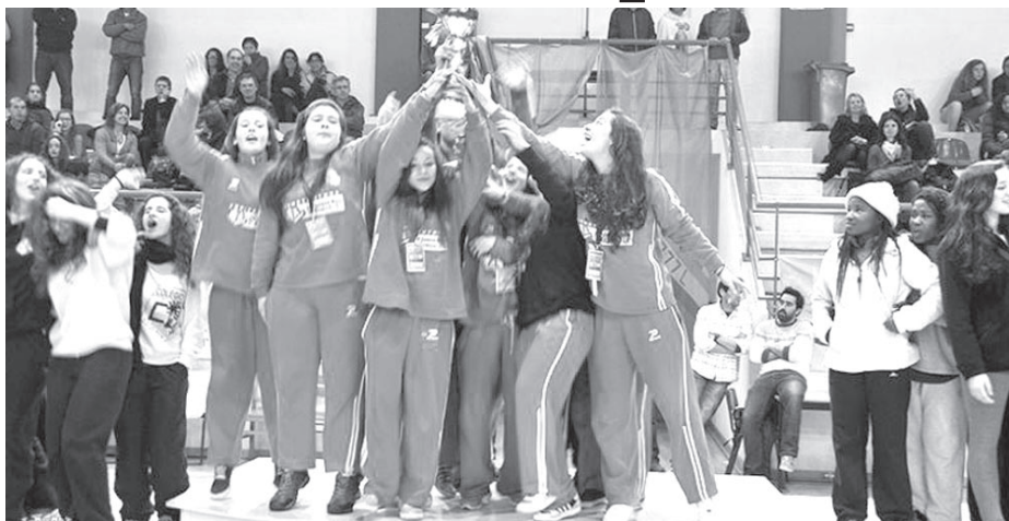
A equipa no momento da consagração

O ambiente na final foi qualquer coisa de extraordinário. Num pavilhão com capacidade para cerca de 1500 pessoas, cheio, as atletas da CBCB, que