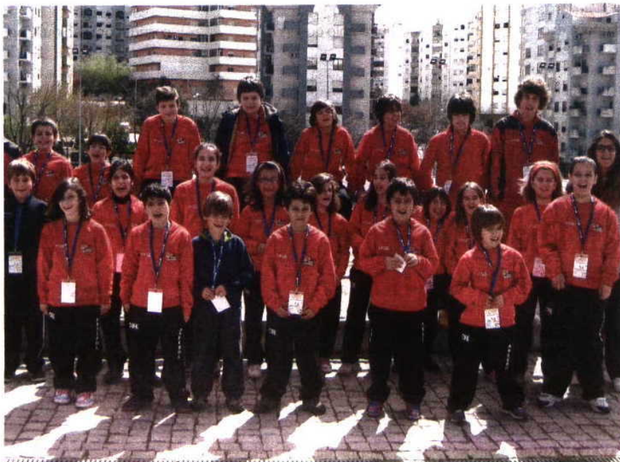
COMITIVA. Jovens do Entroncamento estão de parabéns pelos resultados obtidos

As equipas de bábmbis e minis masculinos, obtiveram seis vitórias em outros tantos jo-