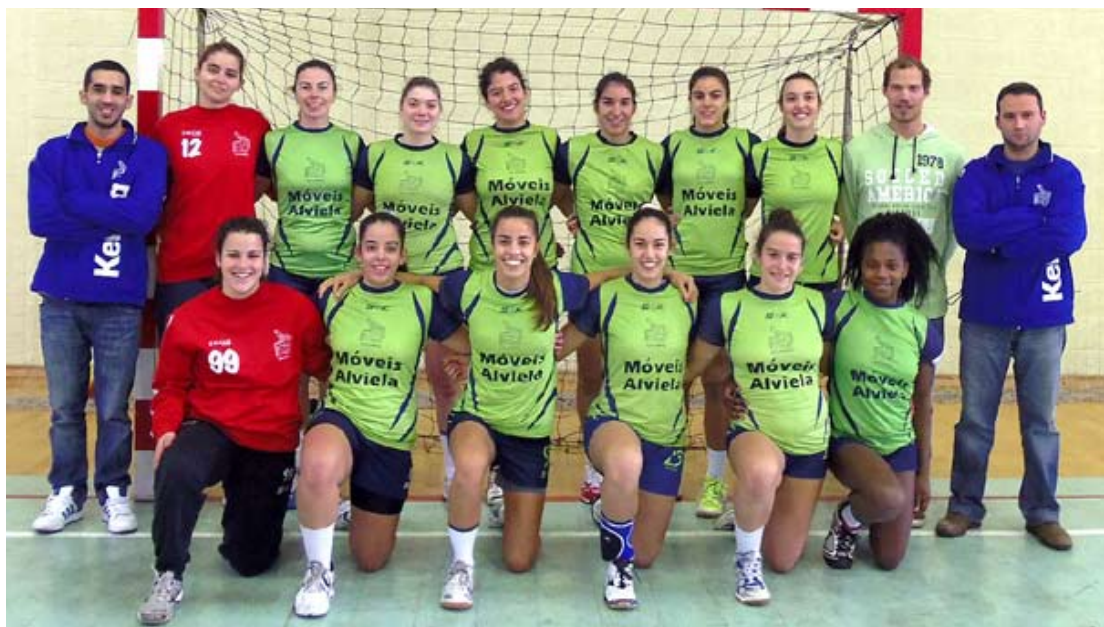
Juventude Amizade e Convívio de Alcanena ostenta, para já, o rótulo de equipa sensação

A equipa sénior de andebol do Juventude Amizade e Convívio, de Alcanena, inicia amanhã o play-off do campeonato nacional da 1.ª divisão em femininos, com a recepção ao Juventude do Lis (16 horas). A formação de Alcanena, a mais jovem equipa do campeonato (utiliza juvenis e juniores), terminou a primeira fase no 5.º lugar.