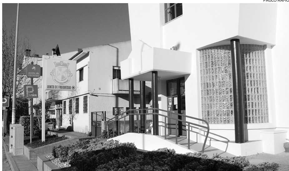
Junta de Freguesia de São Bernardo celebra hoje mais um aniversário