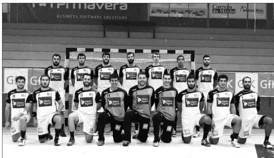
ABC/UMinho quer continuar entre os primeiros