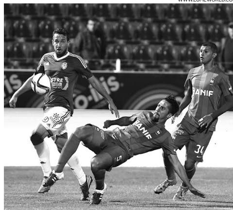
Feirenses de qualidade obrigar os insulares a aplicarem-se

O Feirense, da Segunda Liga, não conseguiu vencer o Marítimo, finalista vencido da última edição da Taça da Liga, em jogo antecipado da segunda jornada da Fase de Grupos, mas deixou uma imagem