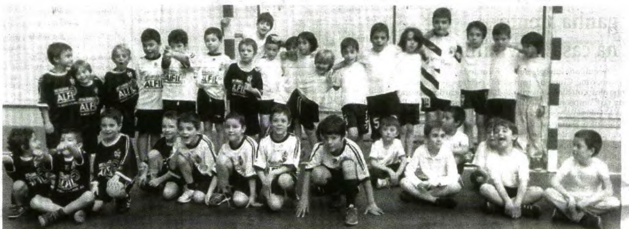
A equipa de andebol de bábis do Sporting Clube de Espinho realizou, no sábado, de manhã, um treino de conjunto com a Associação Desportiva Sanjoanense