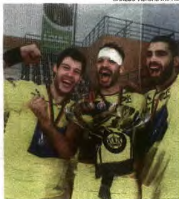
ABC inicia defesa da Taça de Portugal