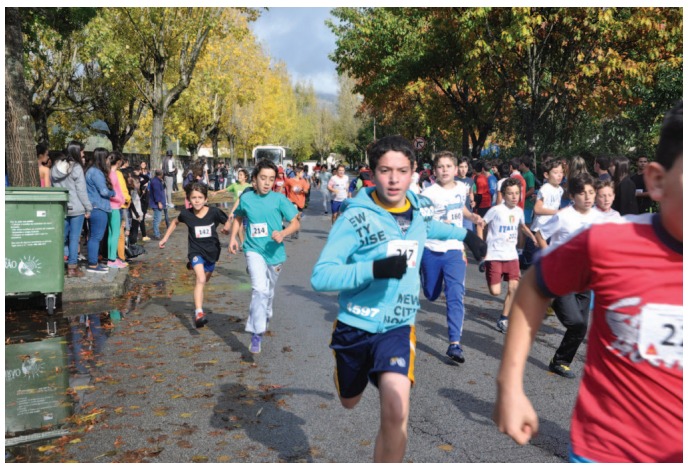
Toda a manhã com provas em diferentes escalões e género

A manhã do dia 28 de outubro foi dominada por uma prova de corta-mato-escolar que decorreu junto à Escola Básica de Campo de Besteiros. Esta atividade desportiva juntou todos os alunos inscritos e autorizados pelos estabelecimentos de ensino que fazem parte do Agrupamento de Escolas de Tondela Tomaz Ribeiro.