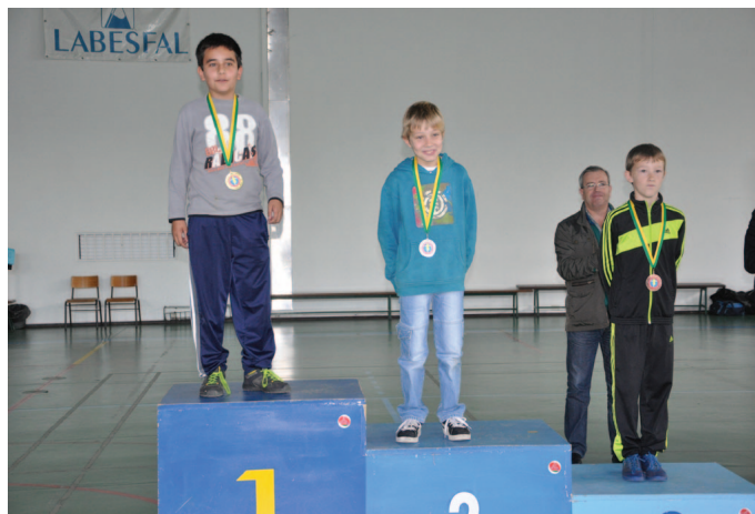
O gosto do pódio saboreado pelos alunos

Ramiro Loureiro lembra que a realizada no dia 28 de outubro foi aquela que é considerada a fase de escola. "Desta resultaram, o apuramento de seis alunos, por cada escalão de género que representarão as escolas noutras provas que serão re-