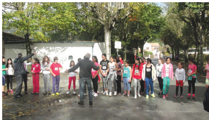
Professores de Educação Física coordenaram a manhã desportiva