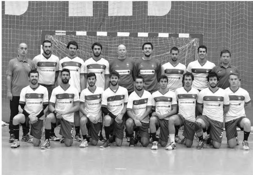
Verde-rubros bateram o Infesta para a Taça de Portugal.

Já o Sports da Madeira recebeu o Passos Manuel numa partida claramente mais equilibrada. Vitória justa das madeirenses por 36-29, com 15-15 ao intervalo. Uma boa atitude competitiva, sobre tudo na segunda parte, ajudou a que o Sports obtivesse o domínio do jogo e com isso tenha assegurando três importantes pontos.