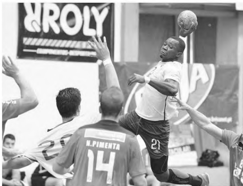
Pavilhão do Funchal recebe hoje uma tarde de andebol.

Logo às 15 horas registe-se o confronto que vai colocar frente a frente ao Madeira Andebol SAD e a formação do Avanca. Os seniores masculinos do Madeira Andebol desejam consolidar o quinto posto na tabela classificativa, perante um adversário que apesar de somar menos quatro pontos, tem vindo a realizar uma prova bastante equilibrada do ponto de vista exibicional. Em casa, no entanto, e perante o apoio dos seus adeptos os madeirenses têm mais um incentivo suplementar para tornarem mais fácil a conquista dos três pontos em disputa que, diga-se em abono da verdade, é uma meta claramente ao alcance dos comandados do técnico Paulo Fidalgo. Na II Divi-