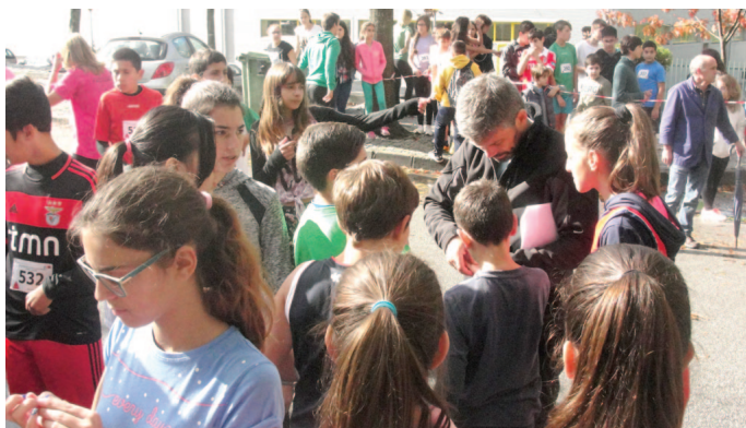
Os alunos mostraram-se sempre entusiasmados com o decorrer das provas

Os centros de formação desportiva já proliferam pelo país na área das náuticas, atletismo, natação, golfe, "em algumas