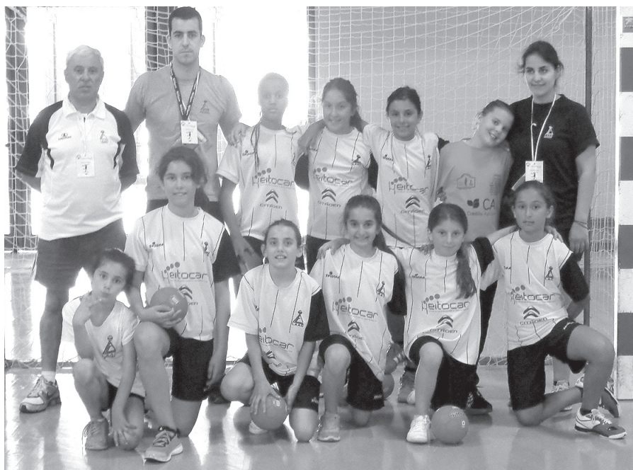
▲ Minis da LAAC no Águeda Andebol Cup