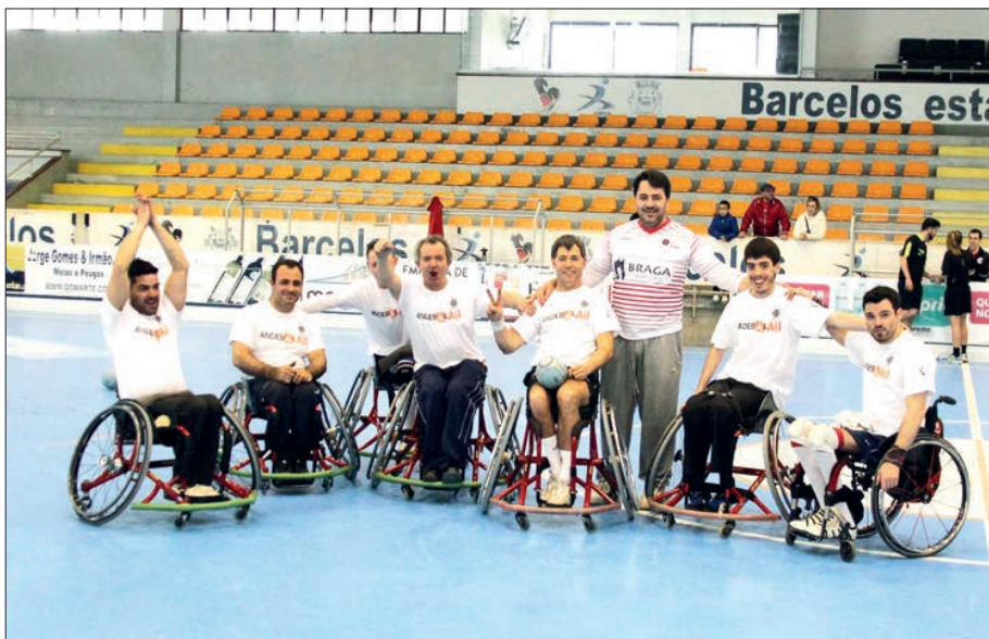
Equipa de andebol de cadeira de Rodas da APD Braga