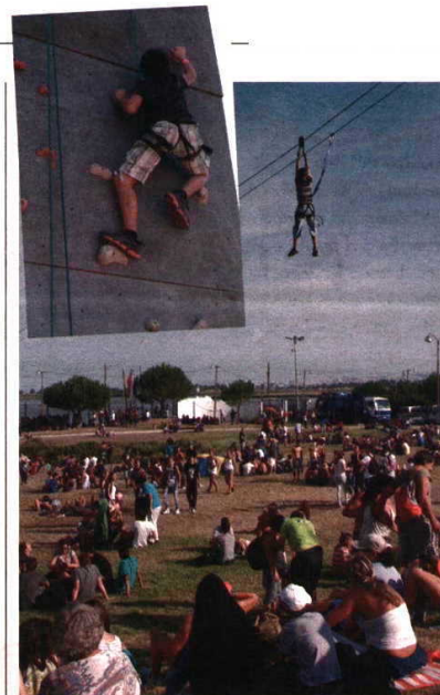
Foram muitos os que quiseram experimentar a escalada

Nesta sua segunda participação na Corrida da Festa, também ele apreciou o «bom ambiente» e a «boa organização», fazendo votos para que este padrão de qualidade se mantenha no futuro. Se assim for, garantiu ao Avante! , «não só perdura como melhora o nível competitivo da prova».