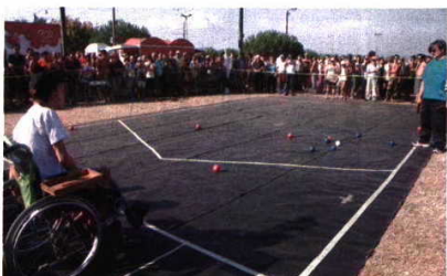
Público não regateou aplausos aos atletas

Assim voltou a acontecer este ano, um ano que está a ser muito especial para a sua escola. É que foi a APCAS que organizou o campeonato nacional de BOCCIA que apurou os nove jogadores que representaram as cores