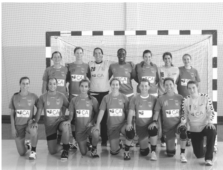
EQUIPA do Colégio João de Barros foi a vencedora do torneio que decorreu na cidade pombalense