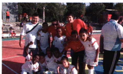
«Os Pastilhas», de Almada, sagraram-se vencedores do torneio

No total foram 1390 as participações em jogos arbitrados por 25 profissionais, organizados por uma equipa de dirigentes e colaboradores do Clube Desportivo e Recreativo do Fogueteiro.