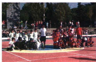
Equipas do Fabril e do Seixal saúdam público antes do início do jogo