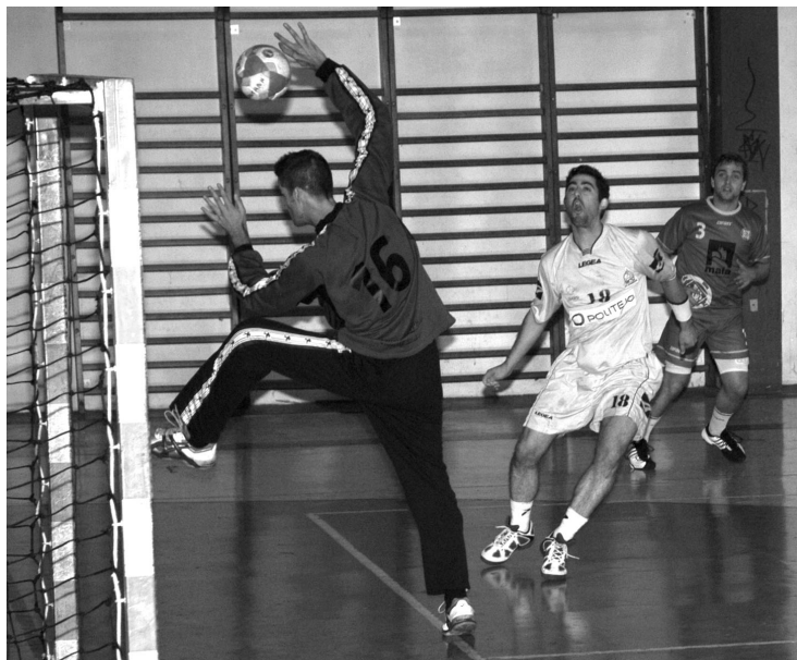
EQUIPA SÉNIOR do Alavarium cessa a actividade temporariamente

Com um universo que engloba cerca de 200 atletas, o emblema aveirense conta com dez equipas em competição, sendo cinco masculinas (minis, infantis, iniciados, juvenis e juniores) e cinco femininas (minis, infantis, iniciados, juvenis e juniores).