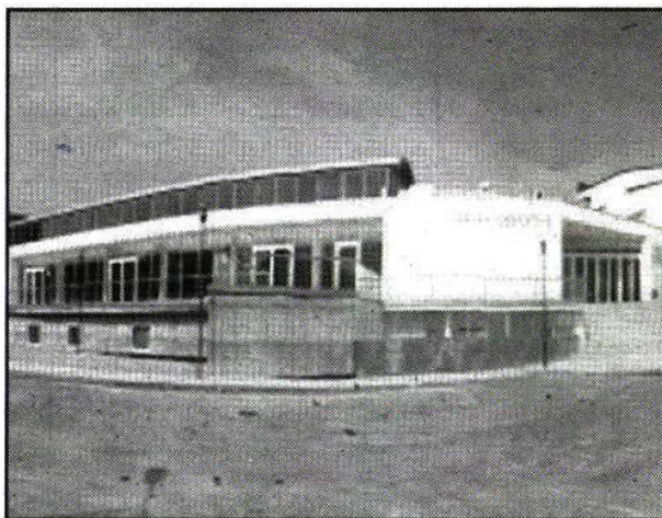
Polidesportivo Municipal de Meda

que Radical, o Mini-campo de Futebol e situa-se próximo do Parque Municipal. Esta infraestrutura vem colmatar as necessidades há muito sentidas pelos jovens da freguesia de Mêda e das freguesias vizinhas, que sempre ansiaram por um recinto para poderem jogar futsal e outros desportos: andebol, basquetebol, voleibol, ginástica, badminton, patinagem, karaté, dança, jogos tradicionais, desportos radicais indoor e que permitirá a organização de diversos eventos e torneios característicos de recintos fechados. Este projeto visa dotar o concelho de Mêda de um Pavilhão