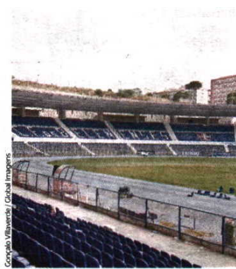
Estádio do Restelo é para rentabilizar