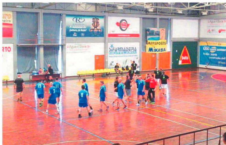
Veteranos abrilhataram também o 'Fim-de-semana do Andebol'.

Nota ainda para o escalão de veteranos, que continua a ganhar novos adeptos, e que tiveram, igualmente o seu espaço reservado neste 'Fim-de-semana do andebol', demonstrando que 'quem sabe nunca esquece'. A festa final deste torneio aconteceu na tarde de domingo com a apresentação oficiais das equipas. P. V. L.