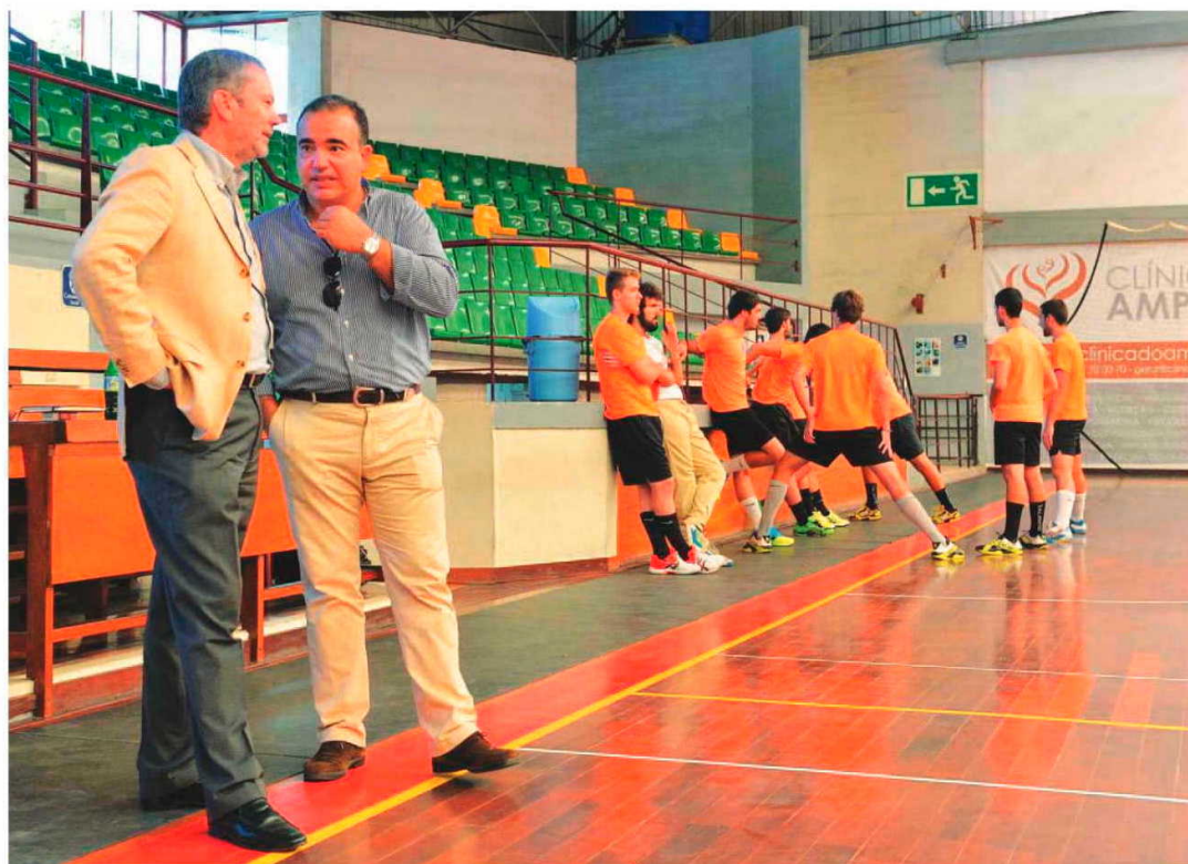
A administração do Madeira Andebol SAD masculina espera ainda que fique saldado os ‘atrasos’ por parte do Governo.

Ao DIÁRIO, o líder do CAB, Francisco Gomes, admitiu existir já um “entendimento de princípio entre o Governo e o CAB: o Governo quer vender, o CAB quer comprar e ambas as partes concordam que é pre-