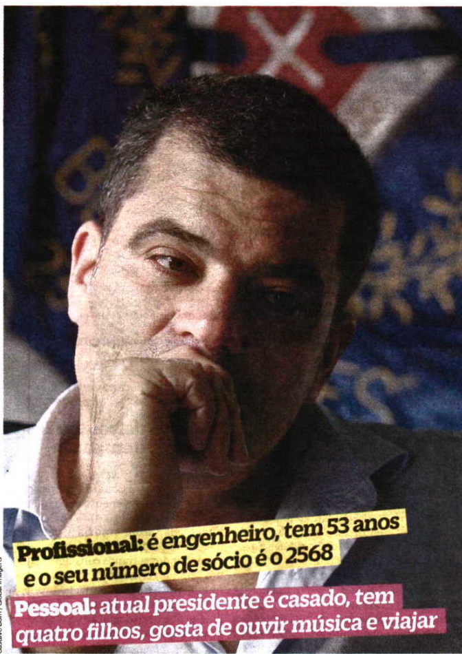
Guilherme Bom / Global Images