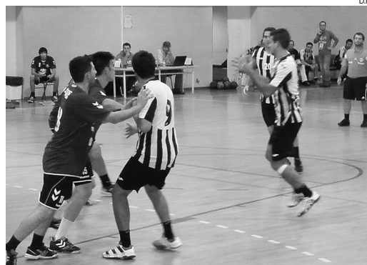
O Beira-Mar ainda mostrou alguma intensidade na primeira parte