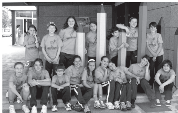
■ As/os jogadoras/es da equipa de Infantis do Sport AndeClube.