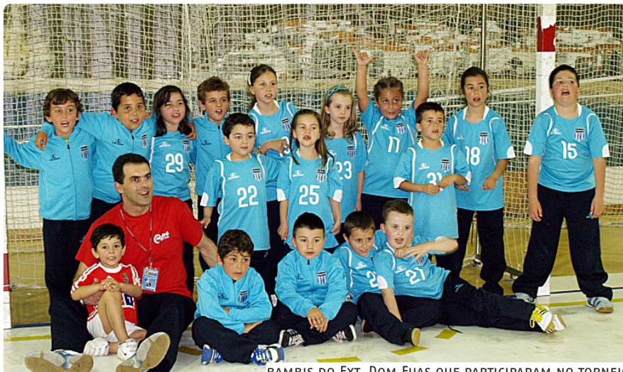
BAMBIS DO EXT. DOM FUAS QUE PARTICIPARAM NO TORNEIO

Terminou em festa a 24ª edição do NazaréCup, torneio internacional de andebol jovem que reuniu na vila mais de um milhar de atletas, em representação de 61 equipas nacionais, espanholas, francesas e polacas.