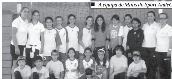
■ Os/as jovens andebolistas do S.A.C. com as respectivas técnicas e dirigentes.

seguido alcançar nove vitórias e apenas sofrendo duas derrotas. Estes resultados ao longo do torneio permitiram alcançar o segundo lugar da prova no escalão de Minis, entre as doze equipas envolvidas na competição.