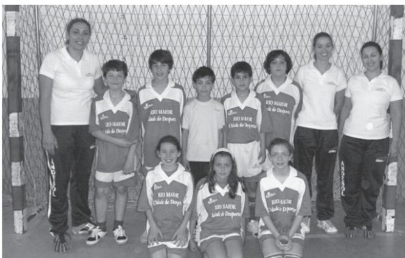
■ A equipa de Minis do Sport AndeClube, 2ª classificada no torneio.

A equipa de Minis do AndeClube realizou onze jogos, tendo con-