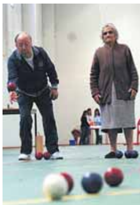
Idosos têm de se movimentar

“As pessoas perguntam-me o que faço, o que como, como durmo. Como é que consigo continuar a fazer o que faço, se tenho algum segredo”, concorda Kotenko. “Não tenho segredos, faço aquilo de que gosto, por isso sou o que sou”, explicou a canadiana, que em Sacramento venceu provas como os 100 e 200 metros, salto em