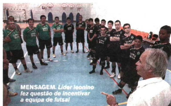
MENSAGEM. Líder leonino fez questão de incentivar a equipa de futsal

grupo de trabalho, sobretudo pela união demonstrada na final do play-off quando o Sporting venceu os três jogos ao Benfica. “Tive a oportunidade de ver duas partidas, uma delas na Luz, que foi inesquecível. E vocês foram um exemplo em termos coletivos”, sublinhou o dirigente, deixando votos de felicidade ao plantel: “Vamos ter uma excelente temporada. Obrigada pela época passada e boa sorte para o novo ano.” □