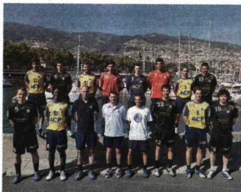
Pré-época Madeira SAD, com três reforços, já treina

mas ao também realistas. Gosto de criar objectivos durante o ano, e para já queremos o apuramento para Portimão [Supertaça]." Quanto ao campeonato, Fidalgo anotou: "Sem saber que lesões e que problemas enfrentaremos, torna-se utópico definir um cenário para daqui a oito meses." Com a equipa já a treinar, concluiu: "As mudanças obrigam-nos a ter paciência na construção de uma equipa vitoriosa." P.C.M.