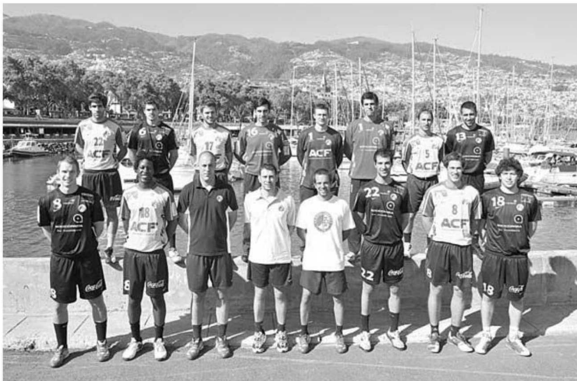
O Madeira Andebol SAD escolheu a cidade do Funchal para realizar a foto oficial do plantel.

HERBERTO DUARTE PEREIRA desporto@dnoticias.pt