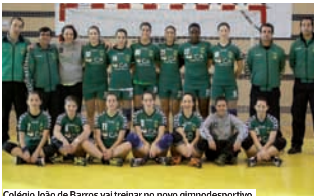
Colégio João de Barros vai treinar no novo gimnodesportivo