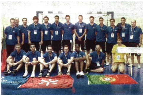
Equipa de andebol sagrou-se campeã da Europa

"Para além de refletir o desempenho desportivo, tem um significado muito grande e resulta da formação integral dos estudantes", referiu José Mendes, vice-reitor da UMinho, aludindo