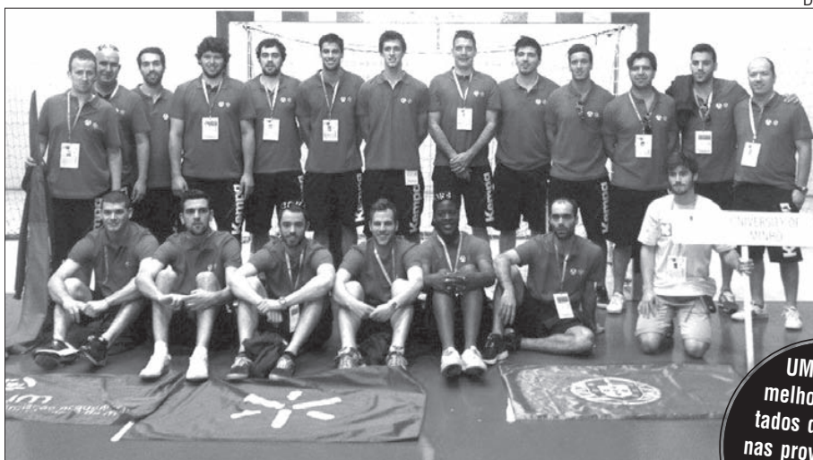
Equipa de andebol masculino da Universidade do Minho

A Universidade do Minho está no topo no Desporto Universitário Europeu. Nesta classificação, entre as mais de 400 academias que participaram nos campeonatos europeus universitários, a UMinho lidera com 45 pontos, seguida das academias de Split (Croácia) e de Valência (Espanha).