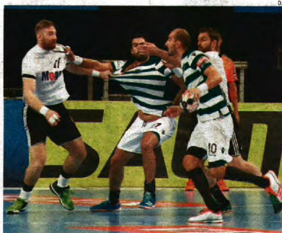
Estrela vitoriosa a do Sporting na Liga dos Campeões. Dia 24 é anfitrião do líder do grupo

sa e contra-ataques começam a estancar o jogo, com Portela e Nikcevic exímios na velocidade e concretização.