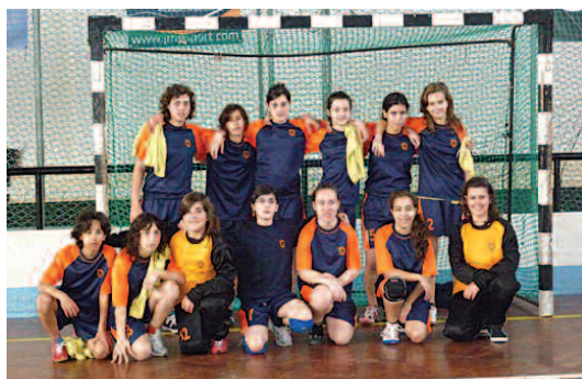
Equipa de andebol da Didáxis

A equipa infantil feminina de andebol da Didáxis de Riba d'Ave iniciou, no passado domingo, a prova complementar do referido escalão, com uma por 36-2 sobre a equipa do Manabola. No final da 1ª fase do campeonato nacional, as meninas da Didáxis obtiveram o