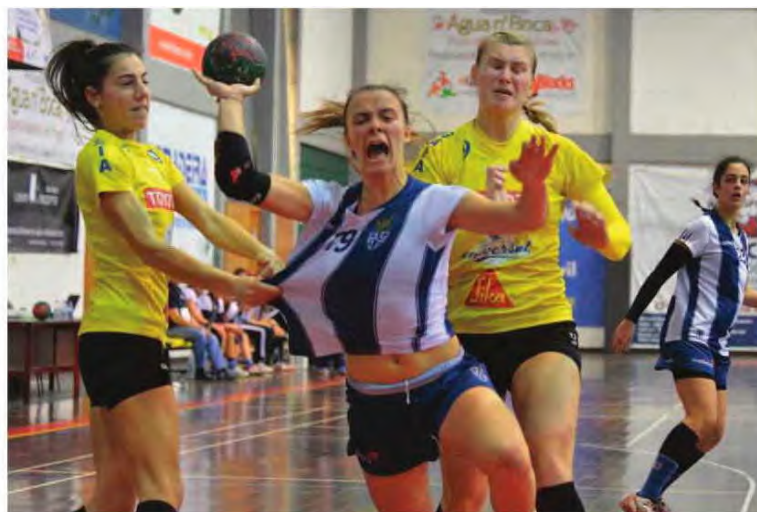
Líder do campeonato foi mais forte que as madeirenses.