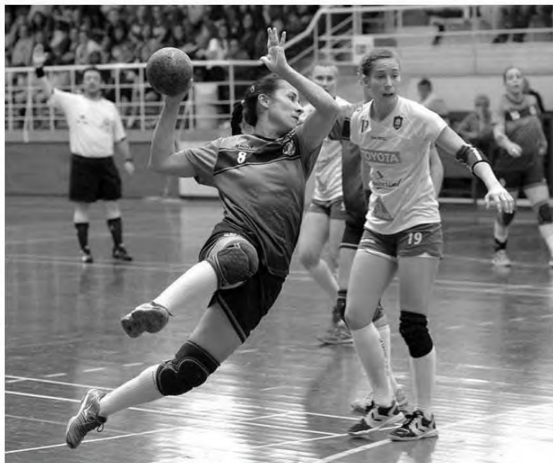
O Madeira SAD foi incapaz de superar o Gaia.

A reafirmação do Gaia como equipa líder da prova, lugar que deverá levar até ao final da fase regular, faz-se porque apresentam um plantel de qualidade com muitas soluções, quase que duas andebolistas por posto específico e quase todas elas de bom nível técnico. Um realidade que permite a não existências de altos e baixos no andebol praticando dando ao jogo