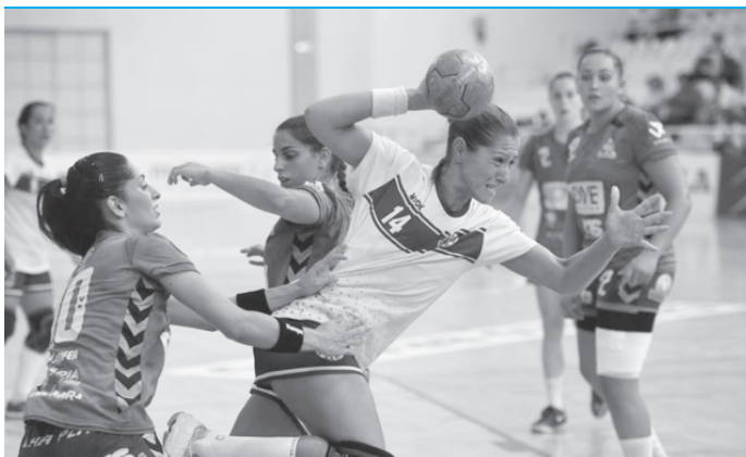
O "SAD" começou algo mal, mas acabou por dar a volta por cima.

O primeiro tempo não correu muito bem às madeirenses, muito por culpa das adversárias, que certa forma justificaram a vantagem de 9-10 que alcançaram em coma do intervalo. Mas no segundo tempo, o Madeira SAD assumiu as rédeas do jogo, vindo a vencer com toda a justiça por