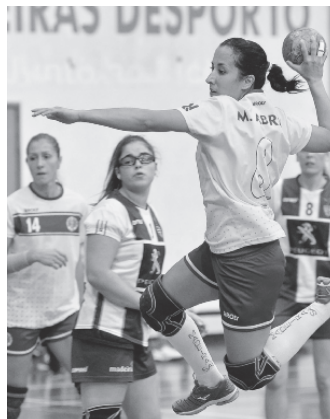
Madeira SAD em luta pela liderança.

M omentos de grande emotividade deverão certamente ser vividos, este fim de semana, no Pavilhão do Funchal, epicentro da luta pela liderança do Campeonato Multicare 1.ª Divisão Feminina de Andebol. O Madeira SAD, que ocupa o 2.º lugar, com 51 pontos, recebe hoje o 3.º classificado, o Alavarium Love Tiles (49 pontos). No jogo da primeira volta, disputado em Aveiro, verificou-se um empate (21-21), mas agora, com o campeonato a entrar na reta final e com a liderança em questão, as madeirenses vão “dar o litro”