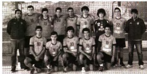
Iniciados Masculinos do Externato Dom Fuas Roupinho

Na 18ª e última jornada do Campeonato Nacional de Iniciados Femininos, zona 4, O Externato Dom Fuas Roupinho venceu no dérbi com o Cister SA, (36-23), terminando a competição no 3º lugar com 40 pontos, enquanto as Alcobacenses ficaram no 6º lugar com um total de 29 pontos. Em jogo da 17ª ronda, o Externato Dom Fuas Roupinho foi vencer fora o SIR 1º Maio, (16-35).