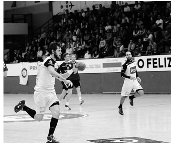
Pavilhão Flávio Sá Leite volta a receber jogos grandes das competições europeias

Agora pela frente os bracarenses têm a equipa do HC Kehra, são teoricamente favoritos e querem confirmar esse favoritismo com a vitória nos dois jogos, que se disputam hoje e amanhã a partir das 17 horas, e confirmar o apuramento para os quartos-de-final da Taça Challenge.