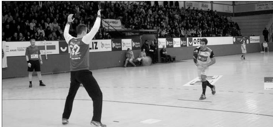
Pavilhão Flávio Sá Leite retorna às tardes europeias