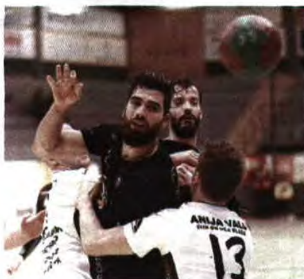
Paulo Jorge Magalhães / Global Images