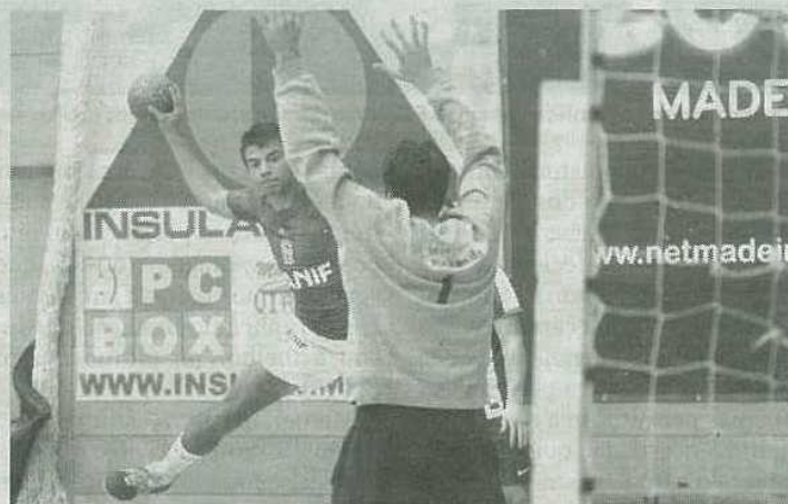
Juniores do andebol triunfam diante do São Bernardo.