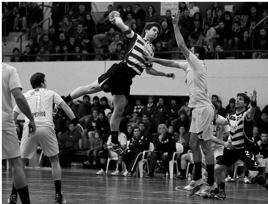
SPORTING , depois de derrotar o AC Sismaria, venceu a final com o ABC, num pavilhão completamente cheio

"A capacidade física faz-se notar nestes jogos contra equipas com outros argumentos. No