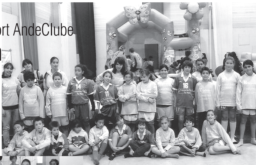
■ Equipa do Sport AndeClube que competiu na ExpoCriança, em Santarém.

No torneio de Andebol da ExpoCriança os resultados foram os seguintes: 1º lugar: Sport AndeClube A, 2º lugar: AREPA A, 3º lugar: Associação 20Km Almeirim