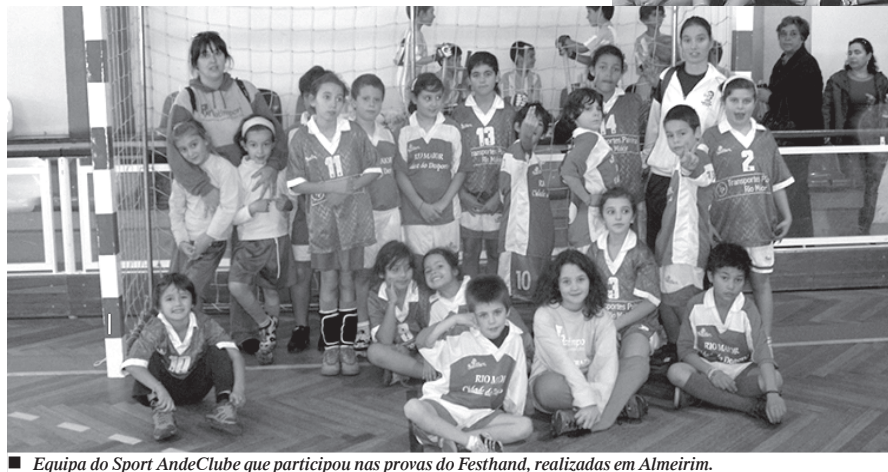
■ Equipa do Sport AndeClube que participou nas provas do Festhand, realizadas em Almeirim.

A, 4º lugar: Sport AndeClube B, 5º lugar: AREPA B, 6º lugar: Associação 20Km Almeirim B, 7º lugar: GF Empregos do Comércio B e 8º lugar: GF Empregados do Comércio A.