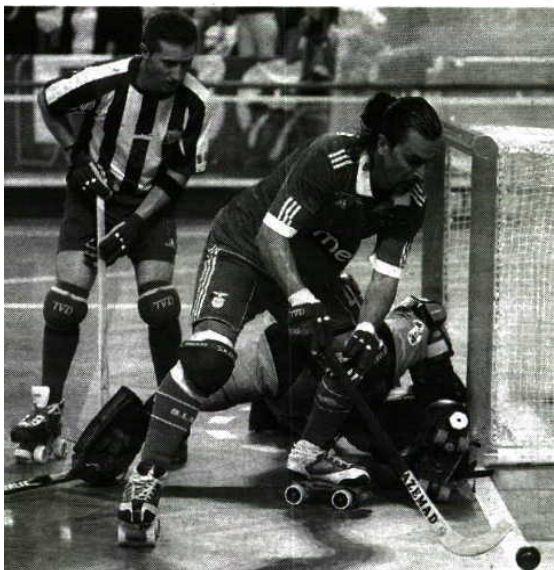
Adiado > Benfica-Porto Santo vai disputar-se no dia 23

"Plafond" Agências de viagens não emitiram bilhetes, afectando várias modalidades