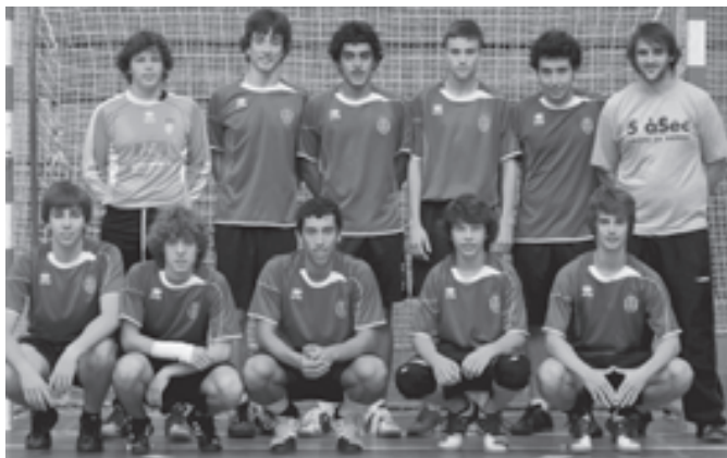
■ Juvenis masculinos do Sporting Clube das Caldas