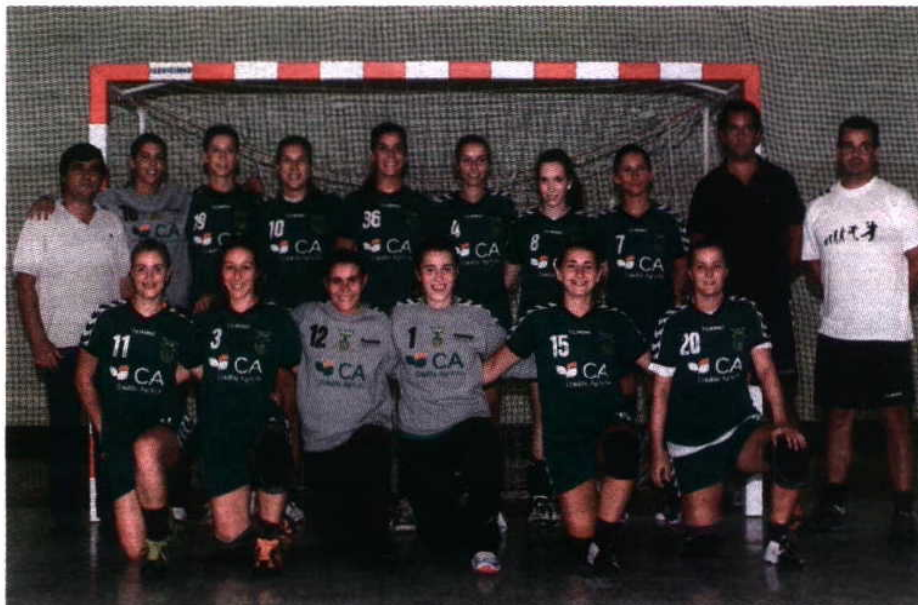
+ Colégio João de Barros voltou a participar numa competição europeia