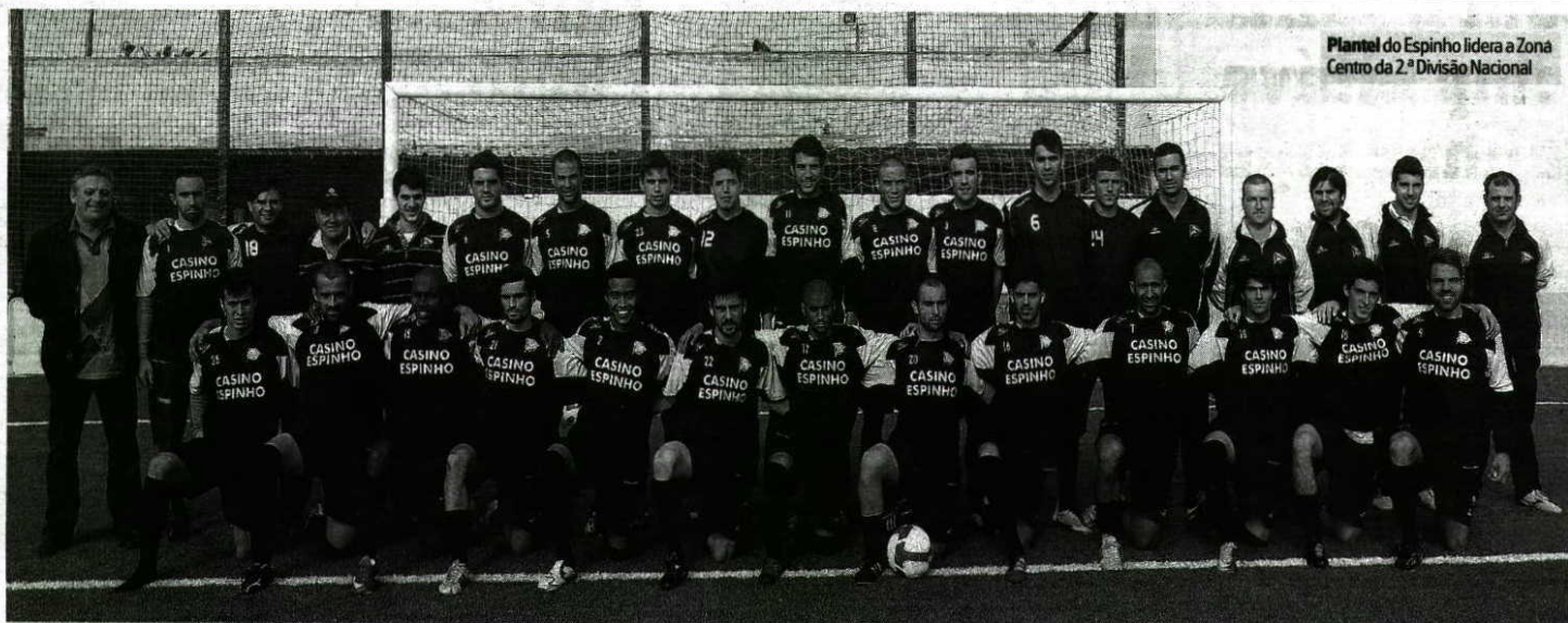
Plantel do Espinho lidera a Zona Centro da 2.ª Divisão Nacional