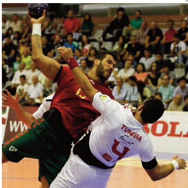
Seleção portuguesa é orientada por Rolando Feitas

No âmbito da apresentação do evento, a escola promoveu um colóquio sobre o tema