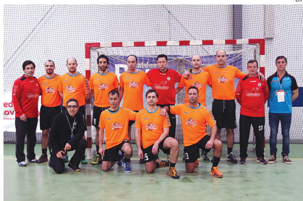
Equipa de Masters da Sanjoanense que disputou o torneio