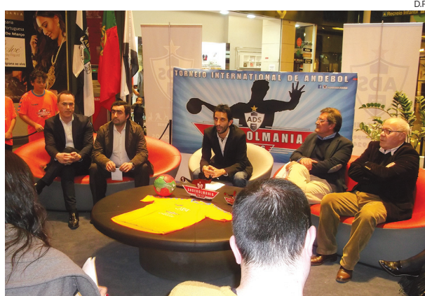
O evento foi apresentado no Centro Comercial 8.ª Avenida

Serão disputados 295 jogos, em 12 pavilhões: dez município, um em Macieira de Sarnes e outro em Arrifana, em ambos os casos freguesias do concelho de Santa Maria da Feira, e a organização vai beneficiar do labor de 120 voluntários. Organizada pelo principal clube sanjoanense, a Andebolmania contará com apoios da Câmara Municipal e, também, da Junta de Freguesia da cidade, que, nomeada-