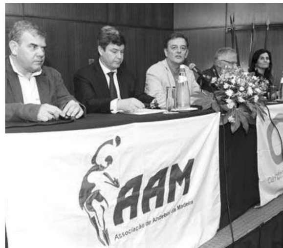
AAM celebra 26 anos de existência.

Nos próximos dias vão realizar-se jogos entre as selecções da Associação de Andebol do Porto e da Madeira nos escalões de Juvenis masculinos e femininos e Juniores masculinos.