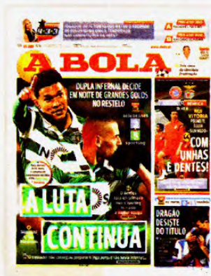
5 de abril