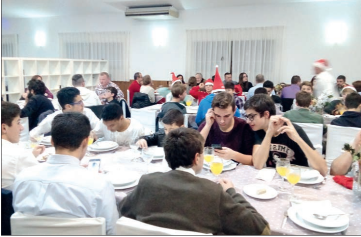
Dois pormenores da Gala do Arsenal da Devesa