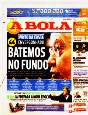
8 de abril