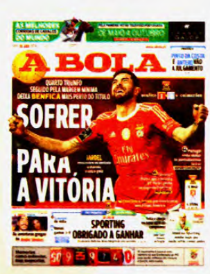
30 de abril