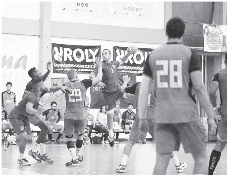
O Madeira SAD ao alcançar o Grupo A voltará a estar na luta por um eventual lugar nas competições europeias.

PF — A nossa equipa apresenta hábitos defensivos de muita competência e ao longo dos meses fomos aumentando a nossa velocidade de jogo. O ataque parece