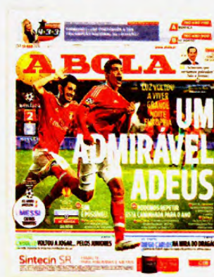
14 de abril