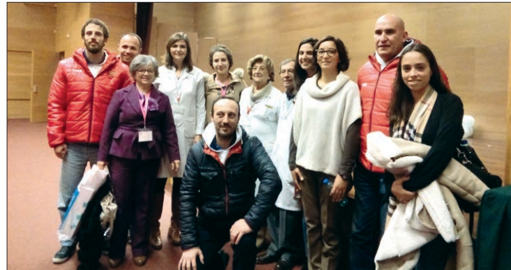
Arsenal da Devesa no IPO do Porto

distribuíram prendas aos miúdos da ala de pediatria do IPO.