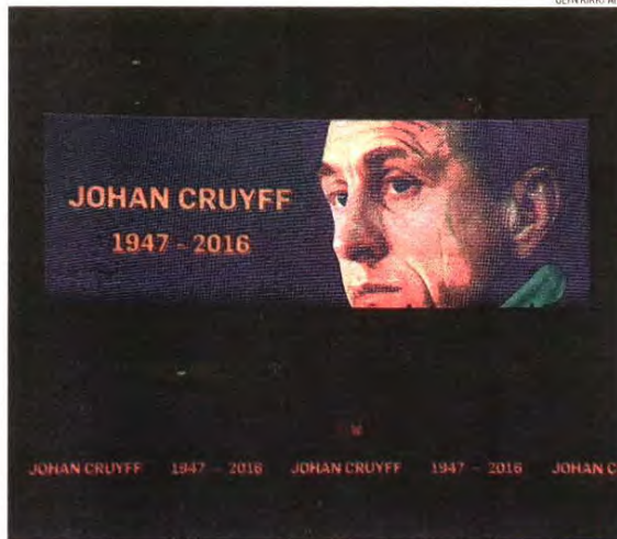
Um nome, uma imagem e uma despedida comum em muitos estádios no mês de março

A 24 de março, morre o treinador holandês e ex-jogador Johan Cruyff, aos 68 anos, vítima de cancro de pulmão, doença contra a qual lutava havia um ano. «Na minha vida tive dois grandes vícios: fumar e jogar futebol. O futebol deu-me quase tudo na vida, ao contrário, fumar quase a tirou», disse, ainda no início dos problemas oncológicos. Considerado um dos maiores futebolistas da história, Cruyff fica para sempre associado ao Futebol Total, o estilo de jogo do Ajax e da seleção holandesa dos anos 70, uma arte de que, nos dias de hoje, o Bar-