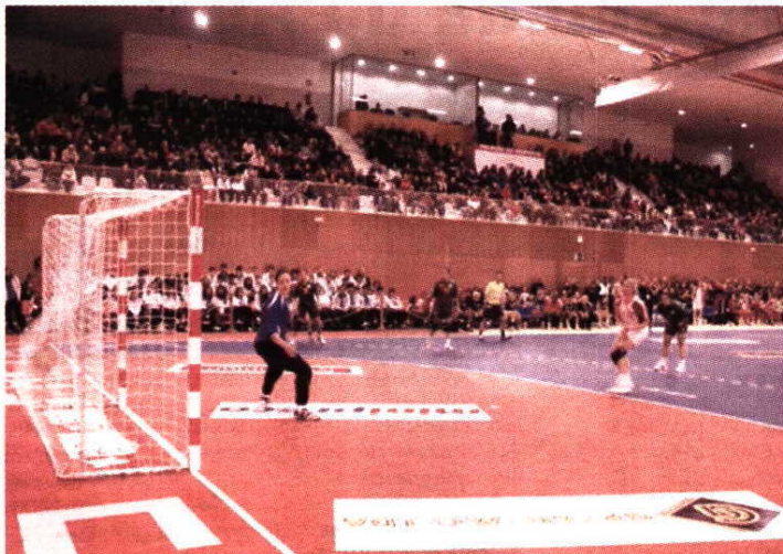
Portugal defrontou a Suíça perante um lotado Pavilhão Municipal de Moimenta da Beira

O encontro foi transmitido em directo pela RTP2 e contou ainda com a presença de vários órgãos de informação local, regional e nacional. A organização esteve a cargo do pelouro do desporto da Câmara Municipal de Moimenta da Beira e da Federação Portuguesa de Andebol, que elogiou o empenho da autarquia.