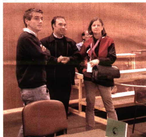
Representantes das diferentes comitativas e entidades