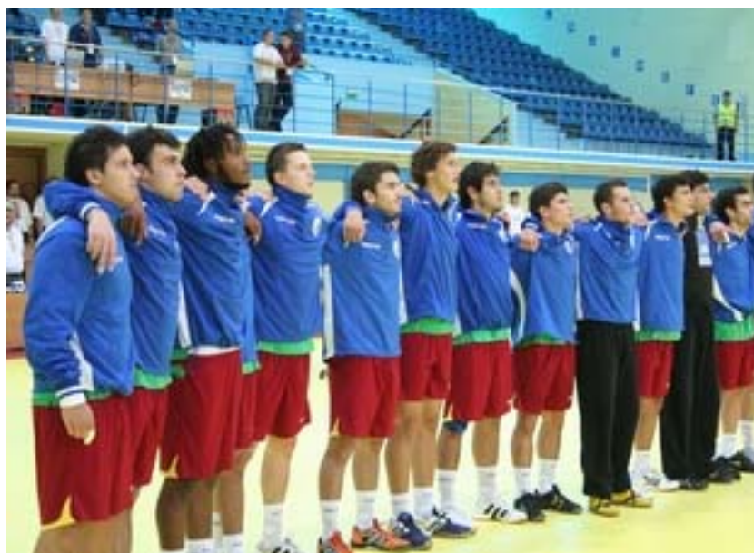
Equipa de Portugal – sétima classificada no campeonato da Europa Roménia 2008