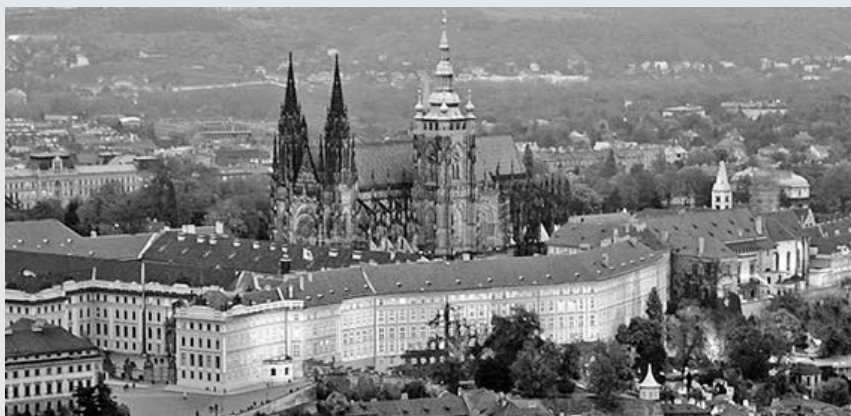
Castelo de Praga impõe-se sobre a paisagem rica em património arquitectónico, cultura, arte e beleza

Cidade turística, tem o seu centro histórico reconhecido como património mundial da UNESCO.