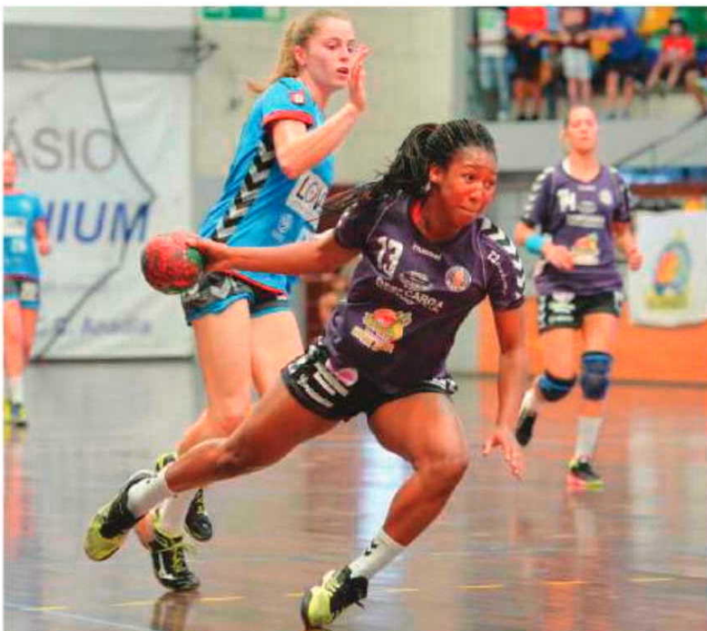
Madeira SAD joga amanhã com o campeão.

Por sua vez, na II Divisão de seniores masculinos de andebol, regista-se um jogo importante que esta tarde acontecerá, a partir das 15 horas, no Pavilhão do Marítimo, onde a equipa verde-rubra