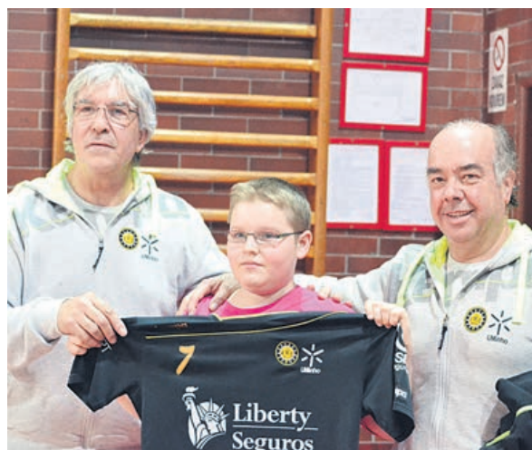
Adepto pediu para comprar camisola do ABC/UMinho, que lhe foi oferecida pelos bracarenenses