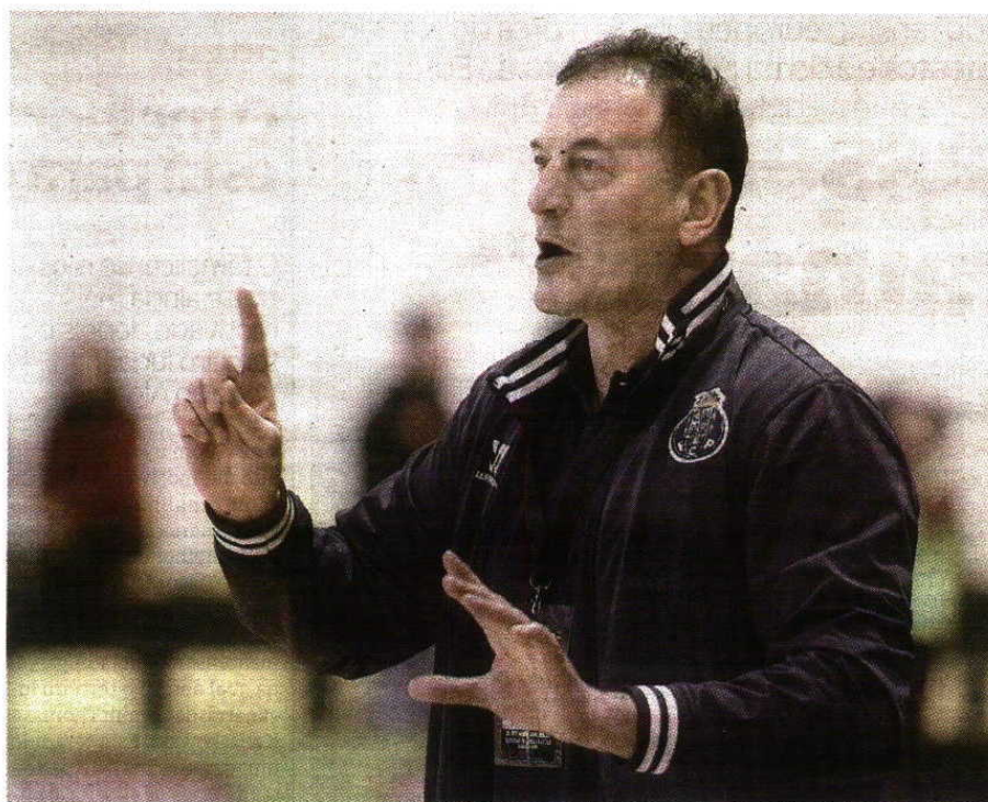
Ljubomir Obradovic garante que há talento no plantel do FC Porto

ANDEBOL Ljubomir Obradovic diz que está habituado a construir equipas e sabe que está em mais uma época em que é essa a função