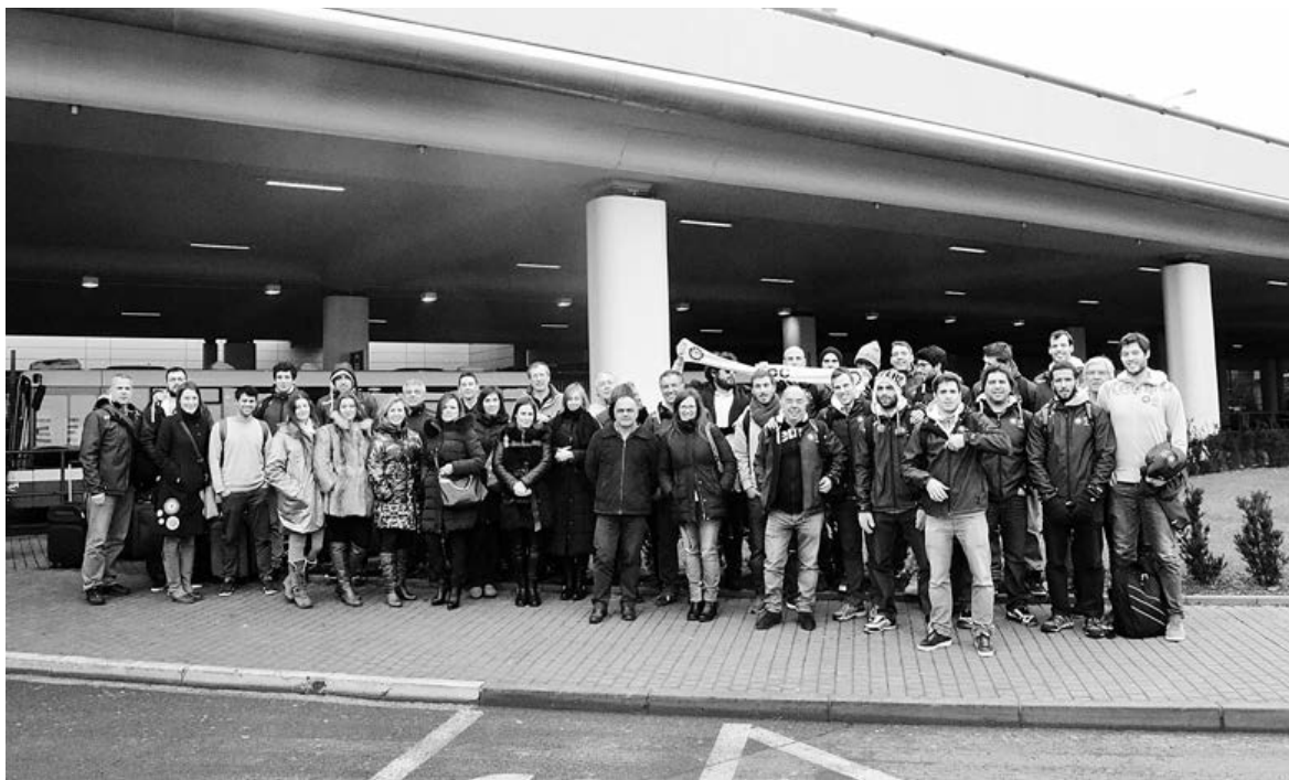
Comitiva do ABC/UMinho uniu-se, na chegada a Praga, para assinalar o momento com uma foto de grupo

Para além dos 20 que acompanharam todas as dez horas de viagem da equipa até Praga e que vão marcar presença no pa-