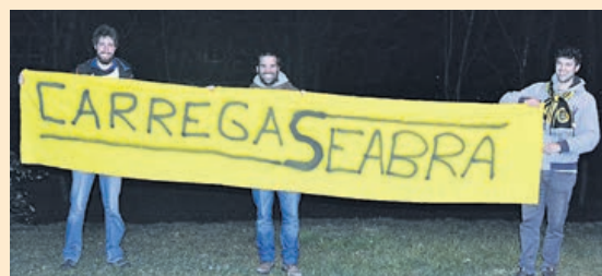
Trio percorreu largos quilómetros para ver o ABC na República Checa