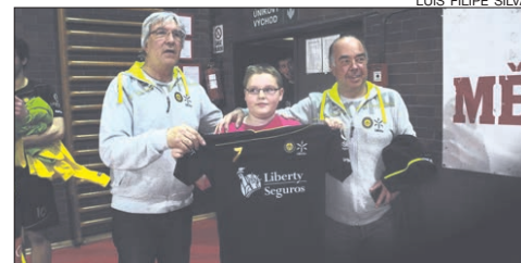
Pequeno adepto do Dukla pediu camisola do ABC