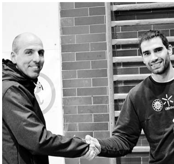
Muita seriedade, mas também boa disposição rondou sempre o treino do ABC/UMinho