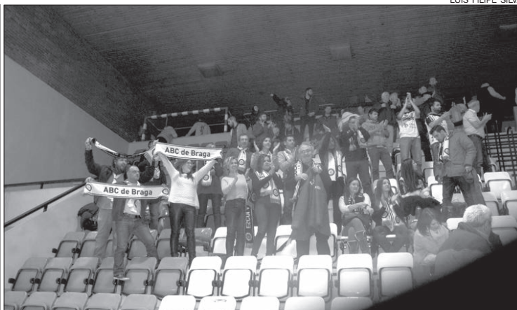
Adeptos do ABC fizeram a festa na bancada