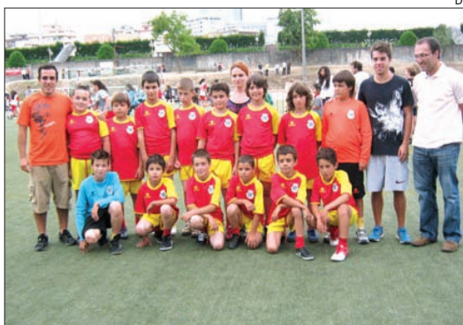
Equipa de andebol de Barcelos

Entre as diversas modalidades praticadas, acabou por ser o andebol a formar uma equipa de jovens atletas que representaram o concelho de Barcelos naquele torneio. No primeiro jogo a equipa de Vila Cova perdeu por 12-11 e no segundo venceu o Salgueiros por 18-8.