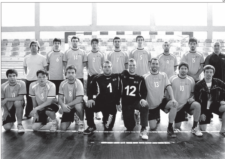
Equipa de andebol da Universidade do Minho

No europeu de futsal, a decorrer na Croácia, os minhotos não conseguiram repetir