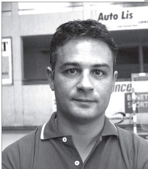
Rolando Freitas, seleccionador nacional

O técnico Rolando Freitas reconheceu, no final, que este «foi um jogo extremamente difícil, como o são todos os jogos do Mundial. Às vezes pensamos que esta equipa, porque perdeu por muitos com outra, é fraca, mas não é assim. Tivemos de lutar bastante por esta vitória».