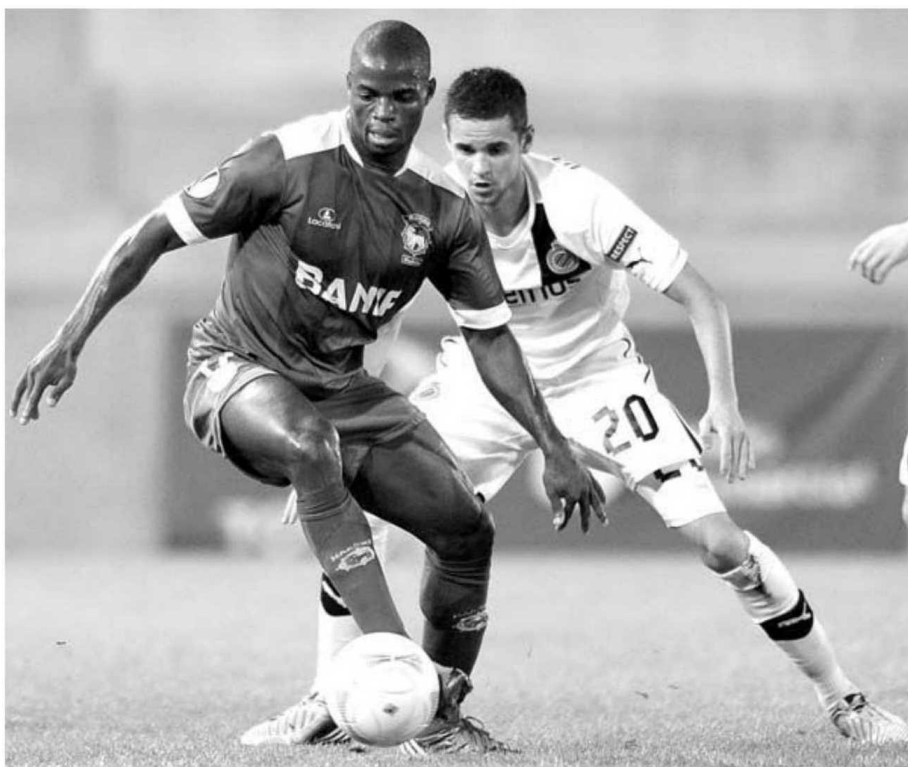
Percentagem do Governo Regional na SAD do Marítimo é de 40% do capital social.

Mas para sair das SAD o Governo Regional também terá de ser chamado a contas na hora de resolver os passivos diferenciados de cada uma das sociedades. Verbas substanciais que terá de assumir na proporção das percentagens que detém: 50% do CAB Madeira, 40% no Marítimo da Madeira Futebol SAD,