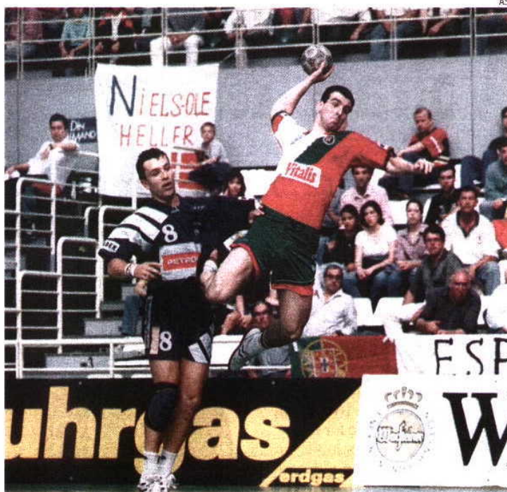
Em 1994 Portugal recebeu o Campeonato da Europa de seniores masculinos

E para que esta organização seja um êxito... «Contamos com o voluntariado das gentes do andebol, o apoio das autarquias e do Governo.»