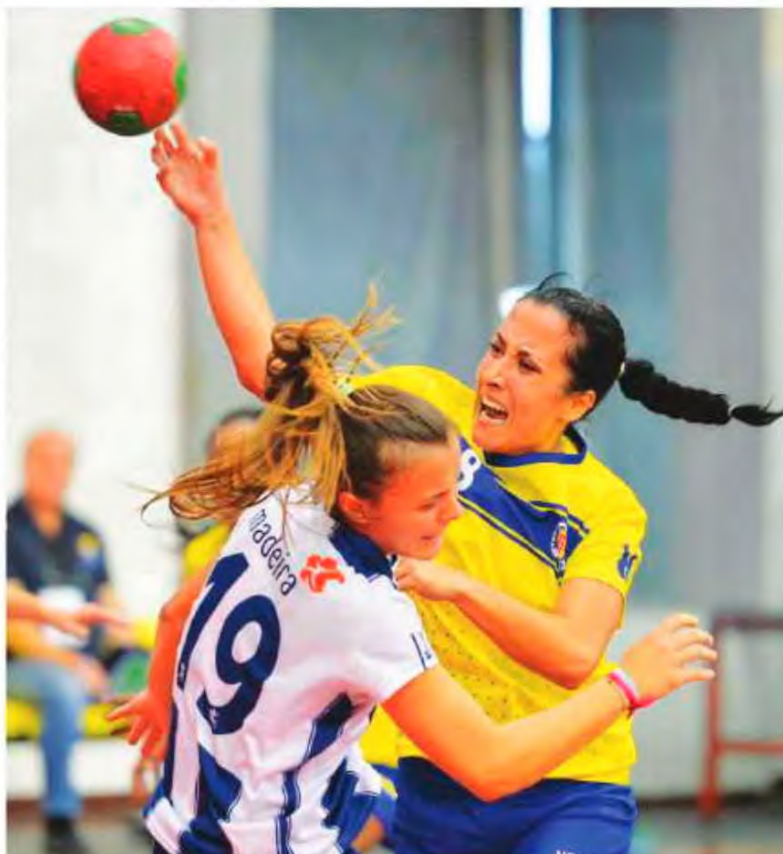
Madeira Andebol /Sports Madeira protagonizam mais um dérbi.