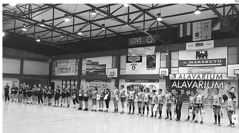
Jogadoras também foram sensibilizadas para contribuir com um bem não perecível

Solidário Alavarium volta a ajudar aqueles que menos têm. Doar alimentos ou produtos de higiene abre portas do pavilhão