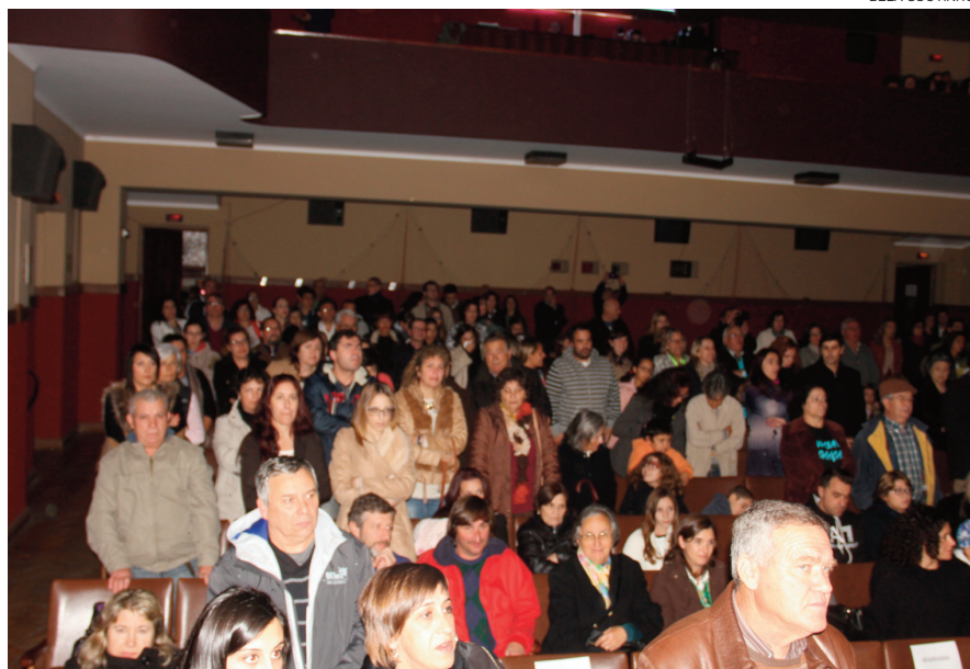
Casa cheia nas celebrações do aniversário do Caras Direitas

Essa é, para já, a grande preocupação de uma casa que movimenta centenas de jovens e crianças - com uma equipa de andebol, fruto de uma parceria com o Agrupamento de Escolas Figueira Mar e a Federação Portuguesa de Andebol, uma academia de ballet, um grupo de dança contemporânea, um grupo de zumba e outro de danças orientais, academia de artes marciais e escola de música - além do Rancho das Cantarinhas de Buarcos, o seu “exlibris”, entre outras actividades, em protocolo com outras instituições, que levam à «dinamização do vasto patri-