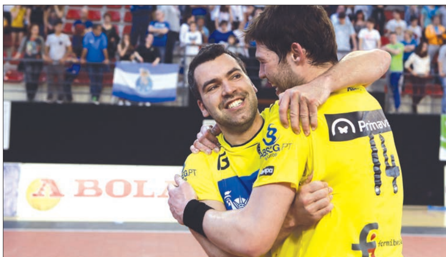
ABC quer iniciar a prova da melhor forma e seguir para os "oitavos"

O jogo entre o clube de Vela de Tavira e o ABC/UMinho tem início às 16h30, no Pavilhão Municipal de Tavira.