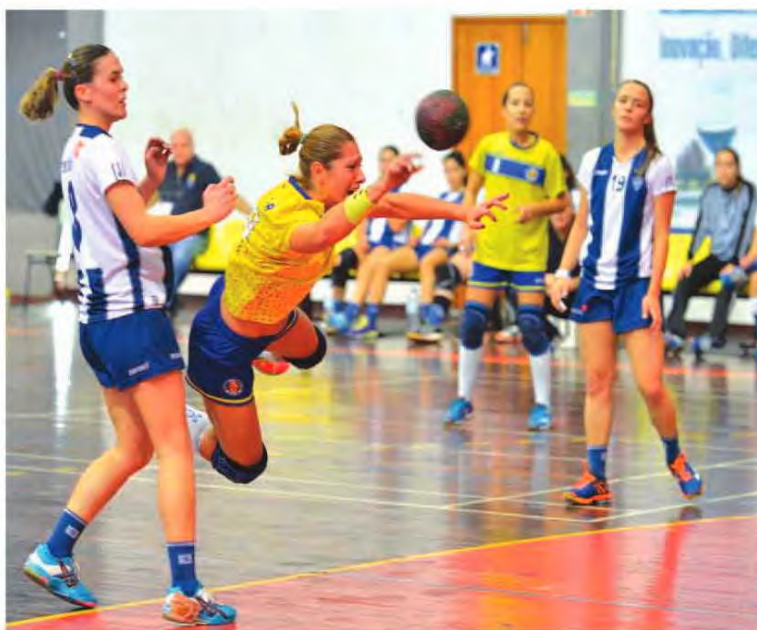
SAD veio a ser superior.

No outro lado as jovens do Sports da Madeira até entraram bem no jogo, com uma boa dinâmica e organização, mas de pouca dura. Desde logo por 'culpa' do adversário, mas também porque as jovens comandadas pelo técnico Marco Freitas tem um longo cami-