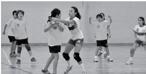
3º encontro de andebol - escalão de minis

Estiveram presentes quatro equipas: JAC Alcanena A e B, Batalha AC e Escola de Andebol do ACR Nadadouro.