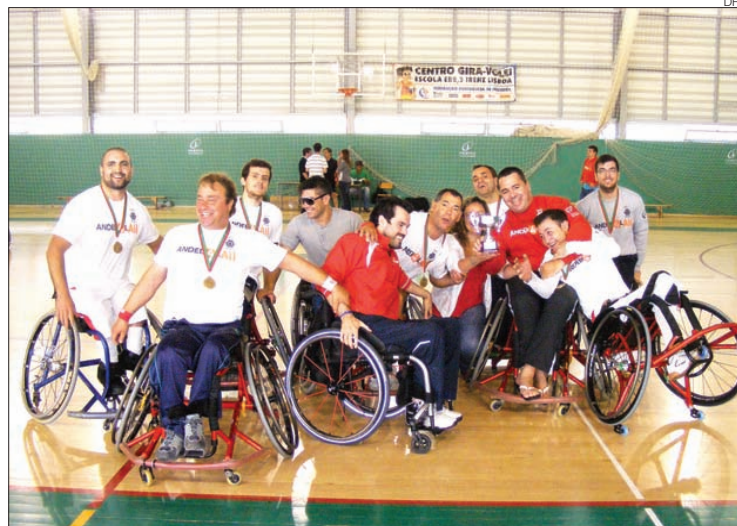
APD Braga faz a festa de novas conquistas nacionais, desta feita, no andebol