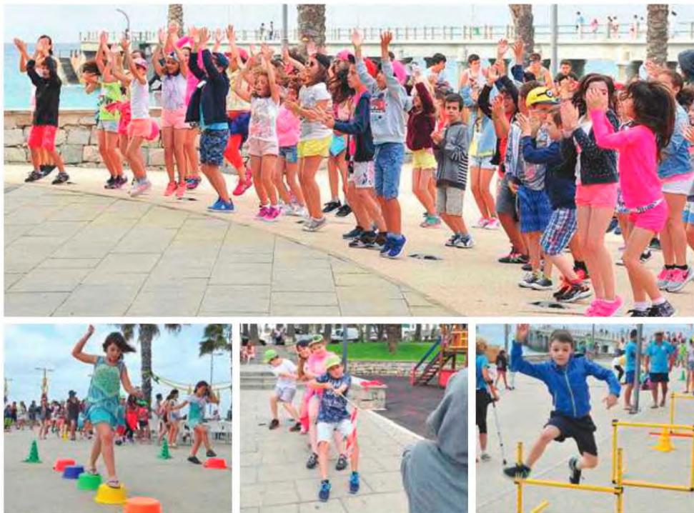
Jogos tradicionais na Praça do Barqueira acabou por cativar os muitos turistas que estão na ilha.