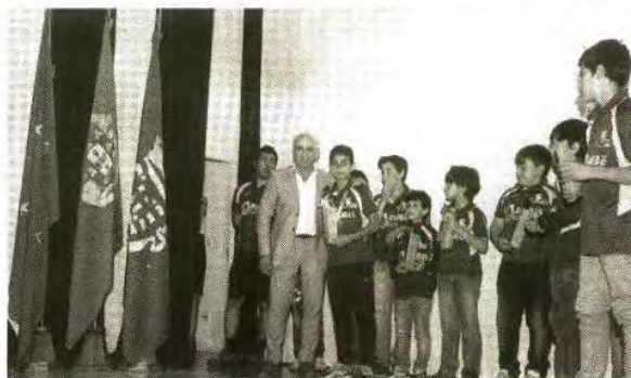
No total, 71 atletas foram homenageados na Gala

O município de Resende homenageou os atletas e clubes do concelho, na Gala do Desporto, que se realizou, no Auditório Municipal, pelo sexto ano consecutivo.