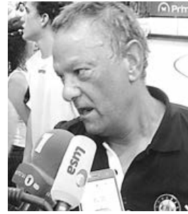
Presidente do ABC/UMinho

Serão constituídos dois grupos de quatro, que vão competir, em regime de concentração. Assim, evitando os eslovenos do Gorenje Velenje (também são cabeças de série), os minhotos vão medir forças com um clube de cada um dos restantes três potes. No pote 2 serão colocados o Tatran Prešov, campeão da Eslováquia, e o Bregenz Handball (Áustria); no pote 3 o Red Boys Differdange (campeão do Luxemburgo) e o Achilles Bocholt (campeão da Bélgica) e, finalmente, no pote 4, o Cocks (Finlândia) e o Macca-bi Tel Aviv (Israel).