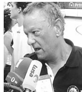
Presidente do ABC/UMinho

Serão constituídos dois grupos de quatro, que vão competir, em regime de concentração. Assim, evitando os eslovenos do Gorenje Velenje (também são cabeças de série), os minhotos vão medir forças com um clube de cada um dos restantes três potes. No pote 2 serão colocados o Tatran Prešov, campeão da Eslováquia, e o Bregenz Handball (Áustria); no pote 3 o Red Boys Differdange (campeão do Luxemburgo) e o Achilles Bocholt (campeão da Bélgica) e, finalmente, no pote 4, o Cocks (Finlândia) e o Macca-bi Tel Aviv (Israel).