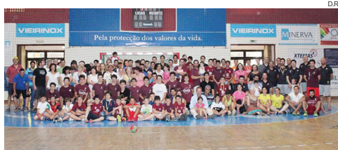
Família do S. Bernardo juntou-se para mais uma “Festa do Atleta”

Uma manhã de pura diversão, num excelente dia sol e onde a boa disposição foi nota dominante. Enquanto alguns transpiravam na tradicional futebolada, já as grelhas queimavam o carvão, preparando-se para receber carnes mistas de forma a ficarem saborosas e saciarem toda a “família” do S. Bernardo,