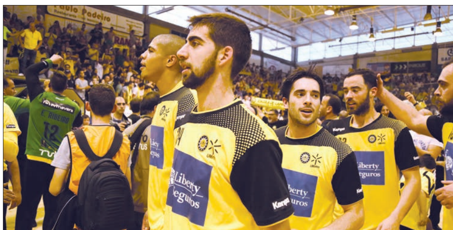
ABC vai lutar por um lugar na fase de grupos da Liga dos Campeões

ABC de Braga vai iniciar a fase de qualificação para Liga dos Campeões de andebol masculino frente aos israelitas do Maccabi Castro Telavive, ditou o sorteio ontem realizado em Viena.