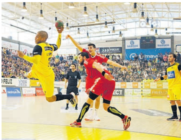
Depois da conquista do título nacional, ABC sonha agora com a Liga dos Campeões

Os vencedores destes dois encontros (ABC-Maccabi Tel Aviv e Bregenz-Bocholt) medem depois forças na final decisiva da 'poule', sendo que apenas o ven-