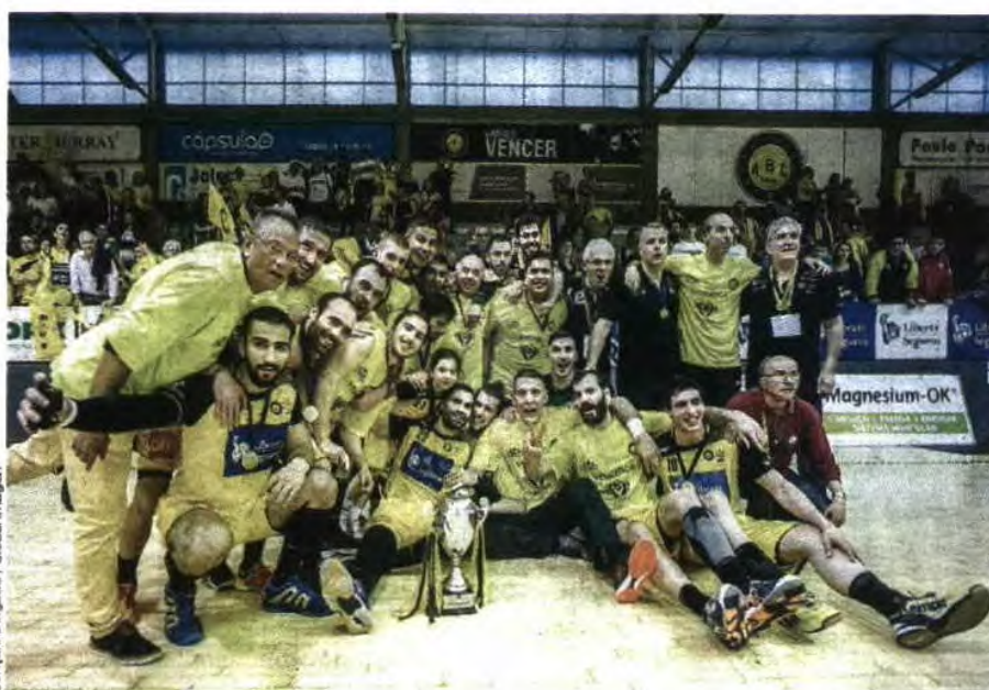
ABC venceu a europeia Challenge Cup e agora tenta entrar na Champions

Com seis presenças na prova, entre 1993/94 (ano em que foi