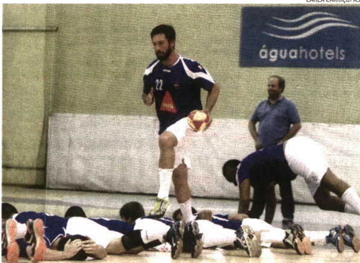
Internacional João Pinto é um dos reforços da equipa do Belenenses para a nova época