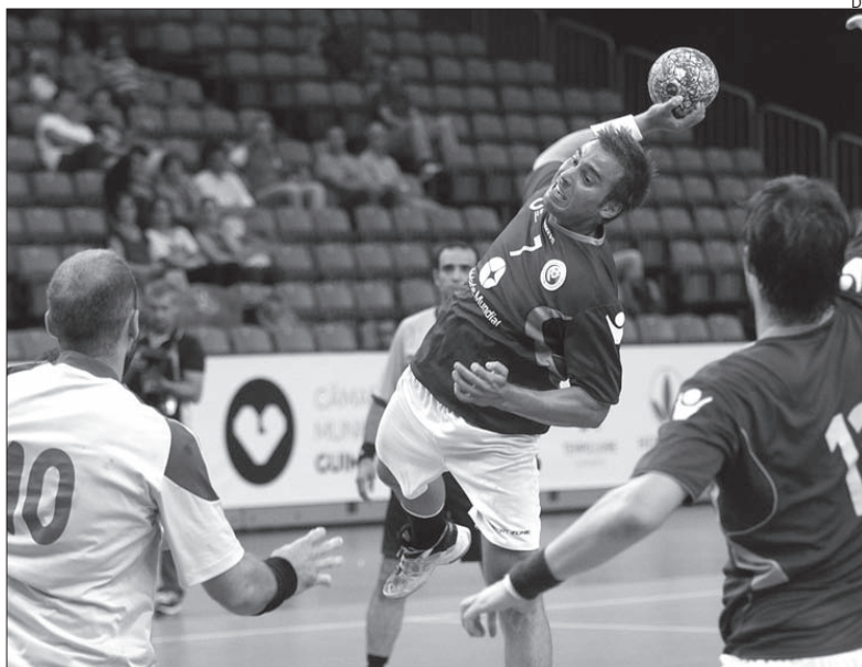
Seleção portuguesa masculina continua em alta no Mundial Universitário

A seleção nacional universitária masculina garantiu ontem o apuramento para as meias-finais do Mundial Universitário de Andebol 2014, que está a decorrer em Guimarães, ao vencer a Roménia, por 32-25.