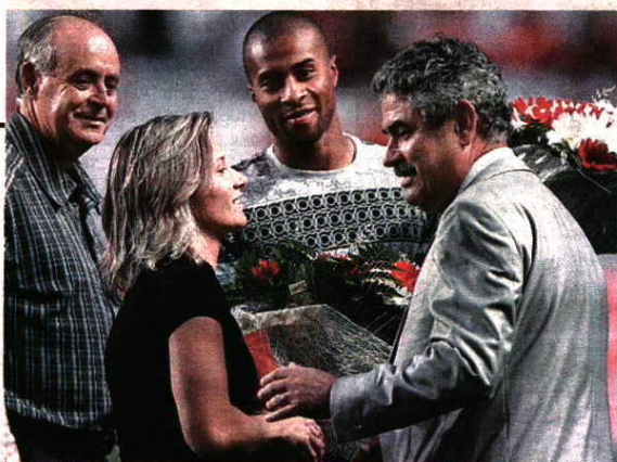
REFERÊNCIA. Telma Monteiro é uma das bandeiras do clube