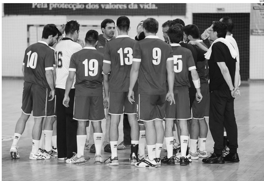
O São Bernardo venceu em São João da Madeira e ultrapassou a Sanjoanense na classificação