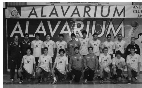
Alavarium estreia-se na segunda fase frente ao Sporting

O primeiro embate desta fase da prova entre os clubes da região vai acontecer à terceira jornada, com o Feirense a receber o Alavarium no próximo dia 28. ◀