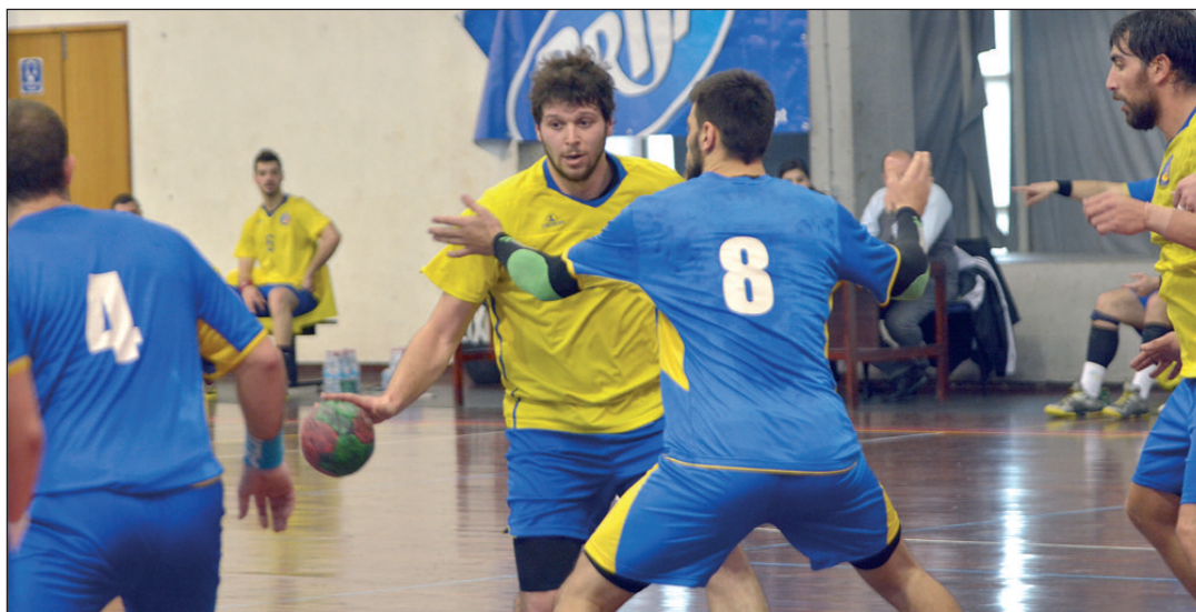
Madeira SAD venceu o Xico Andebol e reforçou a sua posição no apuramento para o Grupo A.