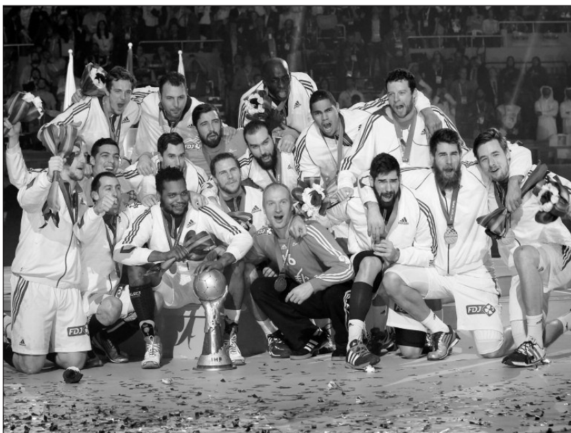
A seleção francesa é a primeira a conquistar cinco títulos mundiais de andebol.

Também ontem, a Polónia assegurou a medalha de bronze, ao vencer no jogo de atribuição do 3.º lugar a Espanha, por 29-28, após um prolongamento. As equipas acabaram empatadas a 24 golos nos 60 minutos do