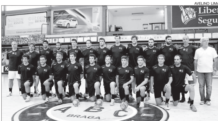
ABC/UMinho espera somar, esta tarde, a primeira vitória sobre um “grande” no Sá Leite