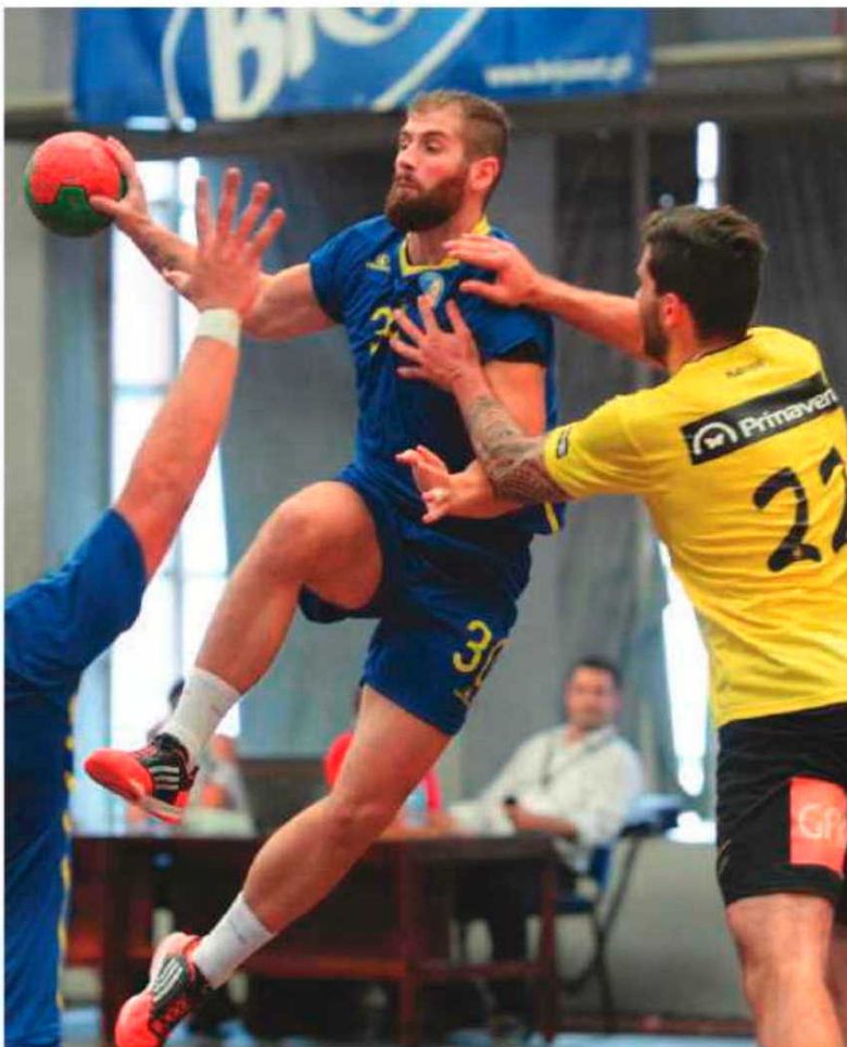
Madeira SAD bateu o Xico Andebol e está na fase final.

Ontem numa partida onde o mais importante era a conquista dos três pontos, uma exibição aceitável por parte da SAD, perante o 'lanterna vermelha', que mostrou qualidade no andebol praticado, obrigando os madeirenses em muitos momentos a desatenções e erros, trazendo ao resultado algum