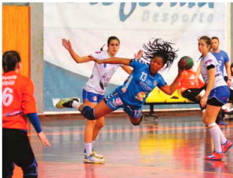
Madeira SAD também vence e diante de um adversário directo.