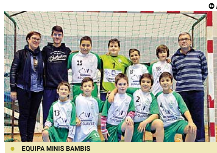
● EQUIPA MINIS BAMBIS

SVR Benfica A (Juvenis) 30 - AD Godim 17