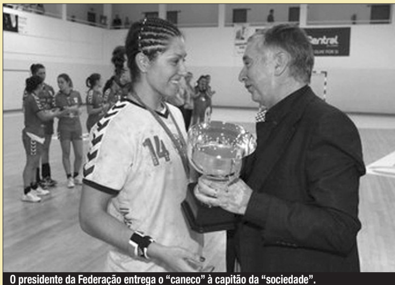
O presidente da Federação entrega o "caneco" à capitã da "sociedade".

Por apenas um golo (25-24) se saldou o triunfo de ontem à tarde, em Leiria, do Madeira SAD sobre a Juventude Desportiva de Lis, na final da Supertaça feminina de Andebol. A prova, que marca o arranque da época 2012/13, permitiu à "sociedade" insular somar a sua 14.ª Supertaça nacional consecutiva, num feito ímpar no desporto luso. Com as madeirenses sempre no controlo do marcador - ao intervalo já venciam por 15-13 - a verdade é que a Juve Lis, jogando "em casa", tudo fez para travar o poderio do conjunto orientado por Duarte Freitas e, em parte, conseguiram-no. Impediram que a SAD "disparasse" no resultado e mantiveram até final a incerteza quanto ao vencedor do 1.º troféu da época, se bem que a experiência do colectivo tivesse sido determinante. Na parte final, a SAD esteve a ganhar por 24-20, mas o adversário reagiu e colocou emoção nos derradeiros segundos. A última posse de bola foi das leirienses, que no entanto não conseguiram levar o ataque até ao