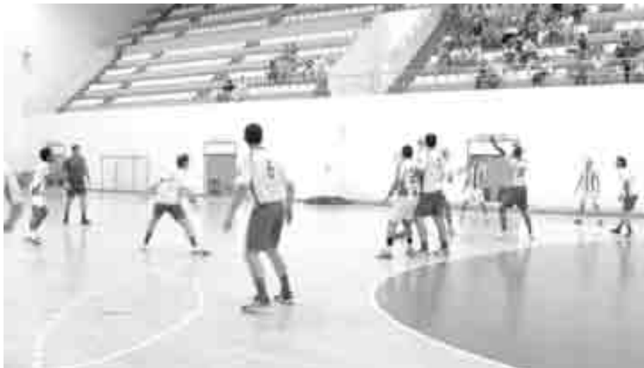
Competições nacionais de andebol estão de volta

Em relação à época anterior há a salientar a presença do Boa Hora e Samora Correia e a ausência do Alto do Moinho que não conseguiu evitar a despromoção.