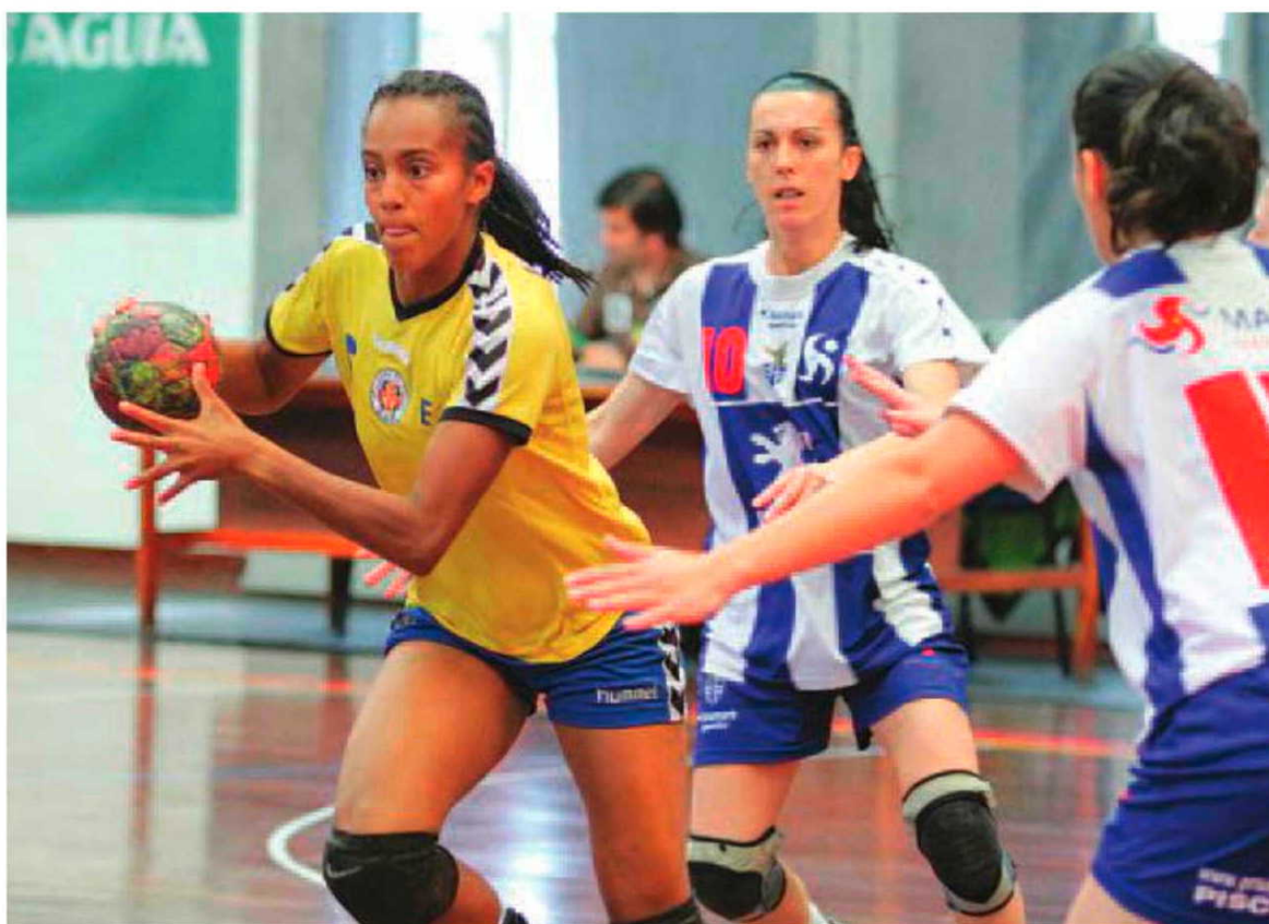
Ontem, em Leiria, o Madeira SAD foi mais forte no dérbi madeirense.