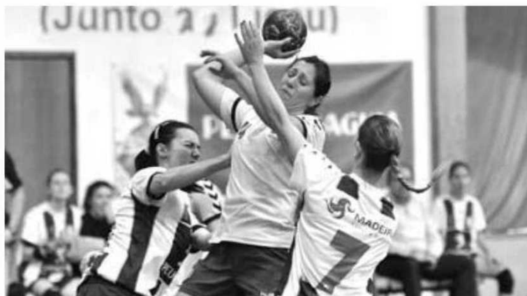
Hoje há dérbi madeirense em Leiria.

A contar para a 1ª eliminatória da Taça de Portugal em seniores masculinos de andebol, o Marítimo vai defrontar o Boa Hora. O jogo disputa-se a 3 de Novembro. H. D. P.