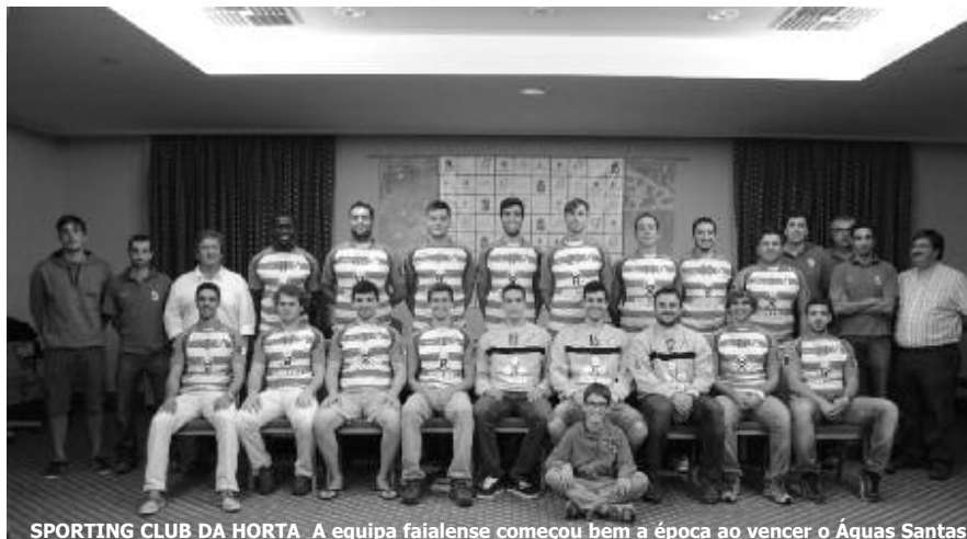
SPORTING CLUB DA HORTA A equipa faialense começou bem a época ao vencer o Águas Santas