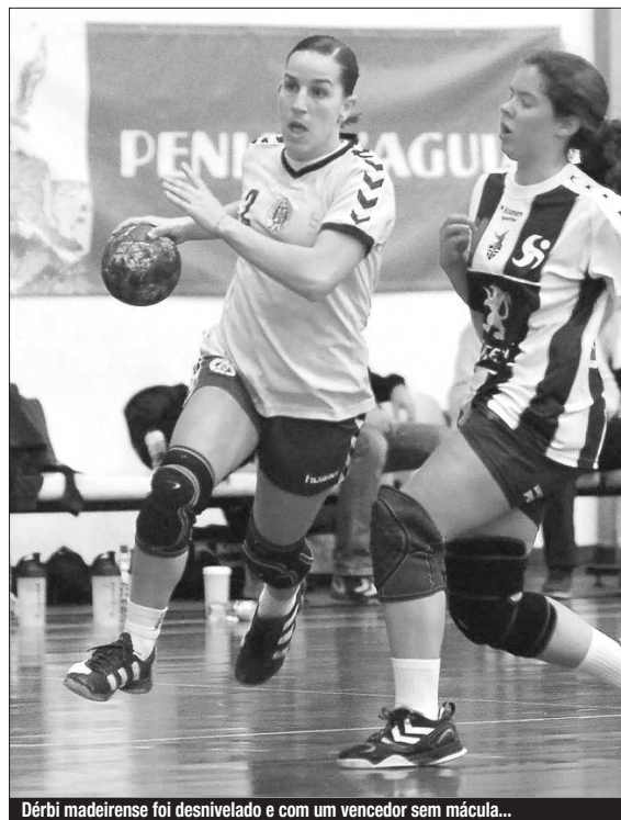
Dérbi madeirense foi desnivelado e com um vencedor sem mácula...