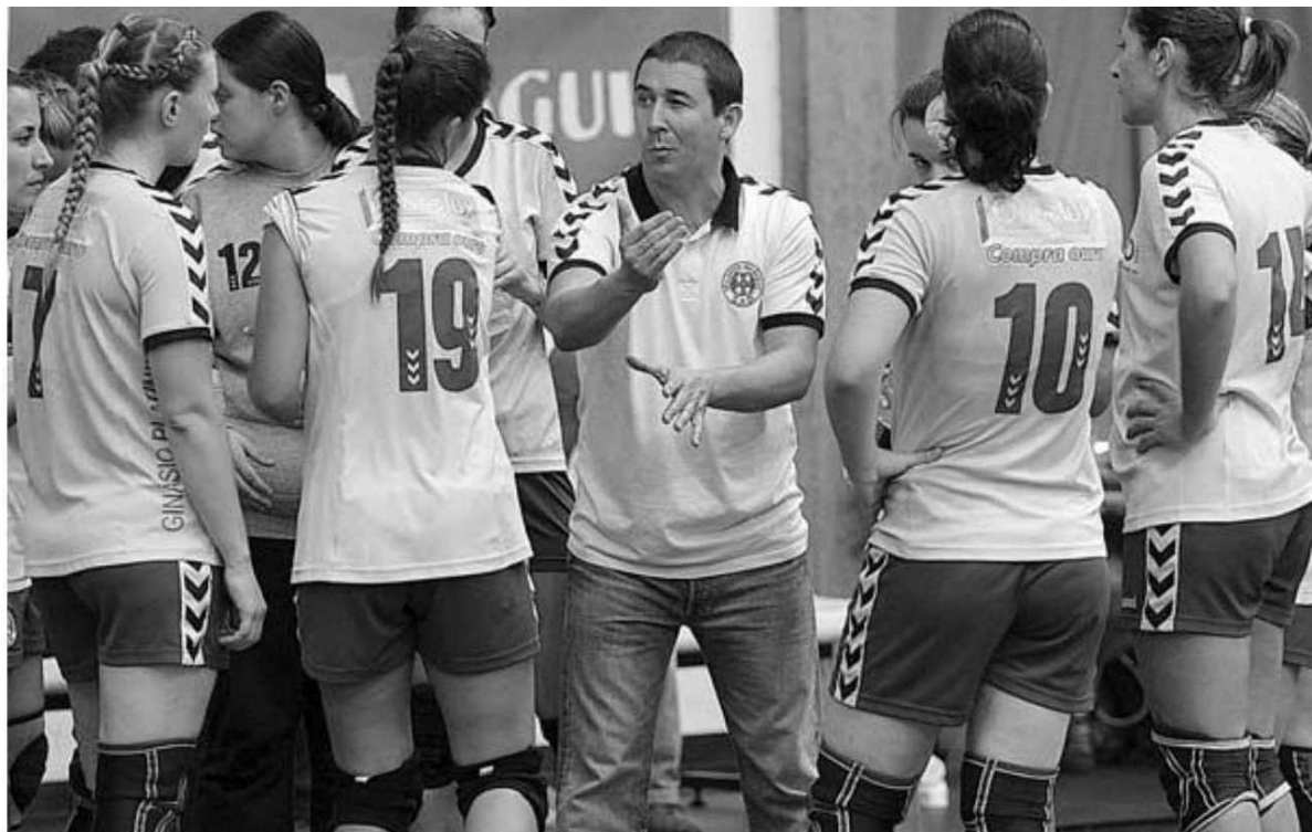
O Madeira Andebol SAD volta a fazer história com 14 finais e outras tantas vitórias na Supertaça.