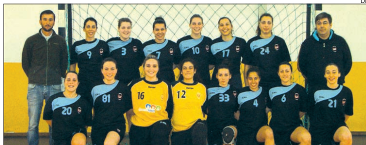
Juventude de Mar em grande na Taça de Portugal