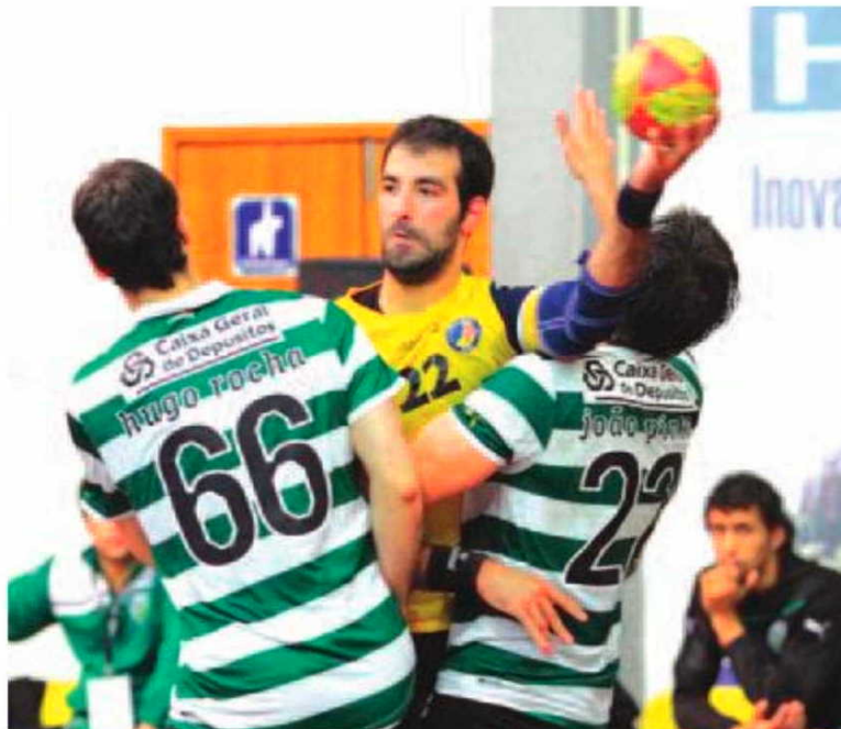
O Madeira Andebol SAD continua a surpreender.

Melhor em todo o tempo de jogo, coube ao Madeira Andebol SAD praticamente toda a iniciativa da partida, perante um Sporting de qualidade, mas que ontem