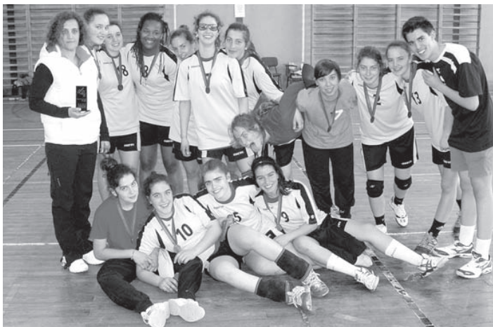
A equipa da ESAP

No campeonato regional, que se realizou no pavilhão da ESAP, no sábado, dia 28 de abril, a escola de Águeda defrontou e venceu o agrupamento de escolas de Aguiar da Beira, por 38-9, e a Escola Secundária Afonso Lopes Vieira, de Leiria, por 35-23.