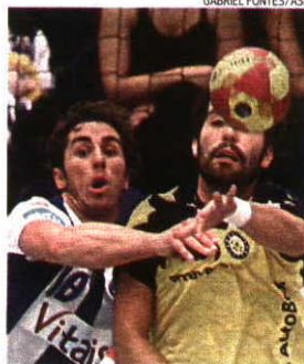
FC Porto e ABC defrontam-se esta tarde

→ Andebol 1 → 8.ª Jornada → Grupo A → Hoje