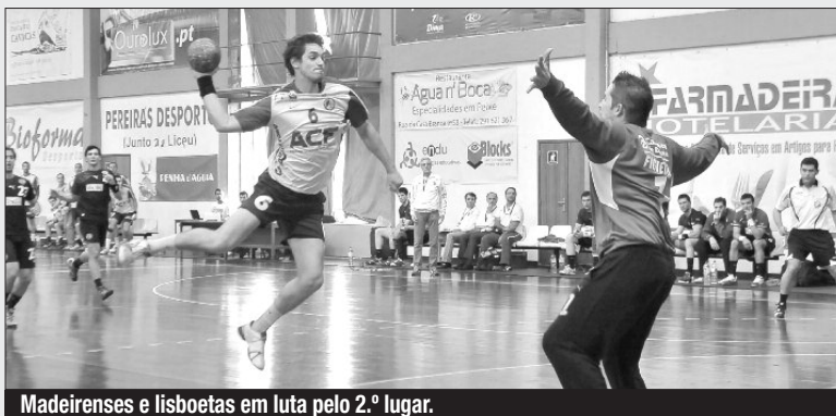
Madeirenses e lisboetas em luta pelo 2.º lugar.

Na fase final da 2.ª Divisão masculina, com dois triunfos e dois desaires até agora, o Marítimo continua à procura de um lugar que lhe dê a subida. Esta tarde (15h), os “verde-rubros” estarão no Porto para medir forças com o Académico FC e um resultado positivo será importante para o futuro dos insulares.