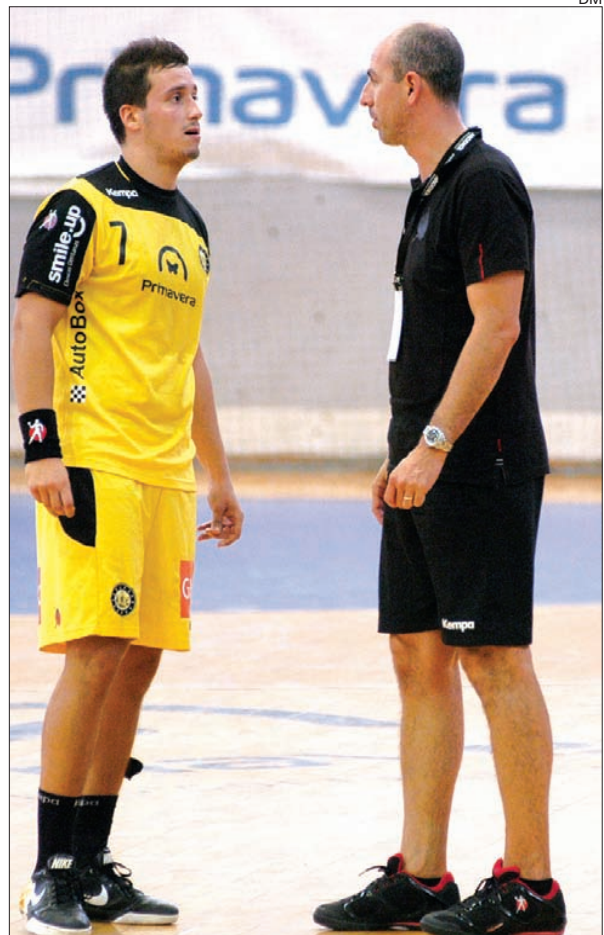
ABC acredita que pode ser o primeiro a vencer no dragão