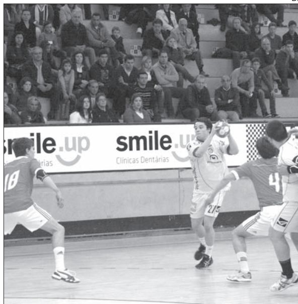
Juniores do ABC procuram selar de vez o apuramento

Os jogos marcados para hoje são: Sporting-Benfica (15h00), Ginásio Sul-Águas Santas (15h00), Belenenses-Marítimo (15h00), S. Bernardo-ABC (17h00), Sp. Espinho-S. Mamede (17h00) e FC Porto-Xico Andebol (17h00).