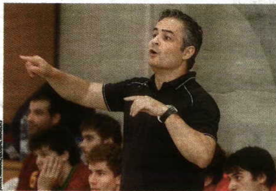
Rolando Freitas > Primeiro português no cargo desde 1988

"O atual selecionador tem contrato até junho, mês que coincide com o play-off de