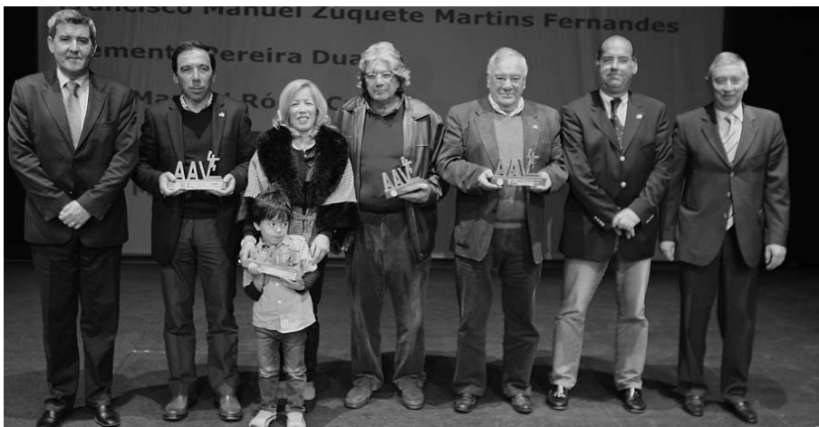
Foram entregues vários prémios

A Associação de Andebol de Leiria (AAL) foi fundada a 29 de abril de 1987, assinalando os seus 25 anos de atividade no passado domingo, com um conjunto vasto conjunto de iniciativas, de forma a perpetuar a vida e memória de todos os que