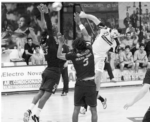
ABC não conseguiu contrariar o tetra campeão nacional