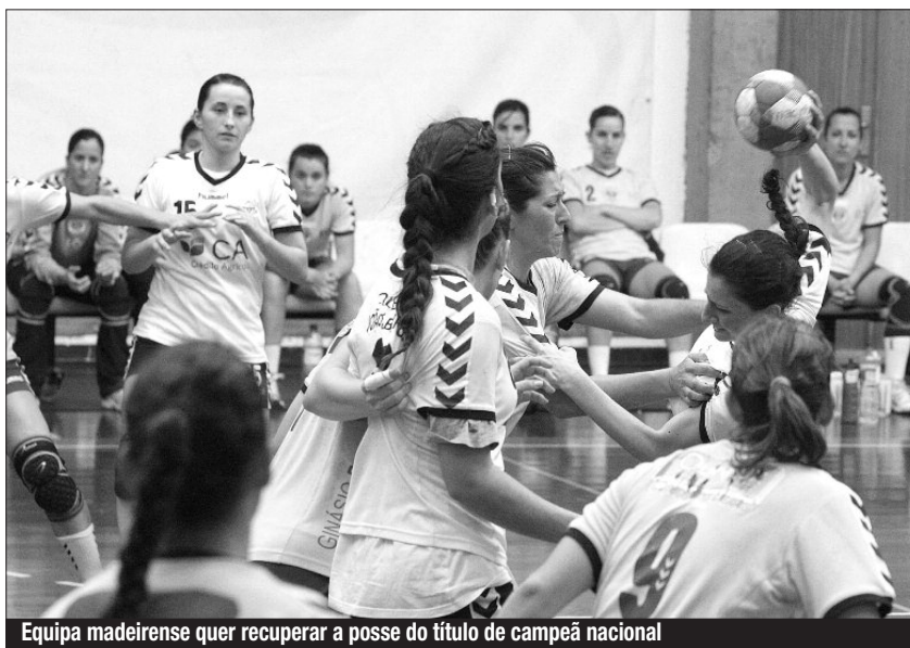
Equipa madeirense quer recuperar a posse do título de campeã nacional