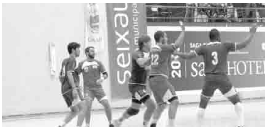
Alto do Moinho superiorizou-se ao Ginásio do Sul e deixou o último lugar