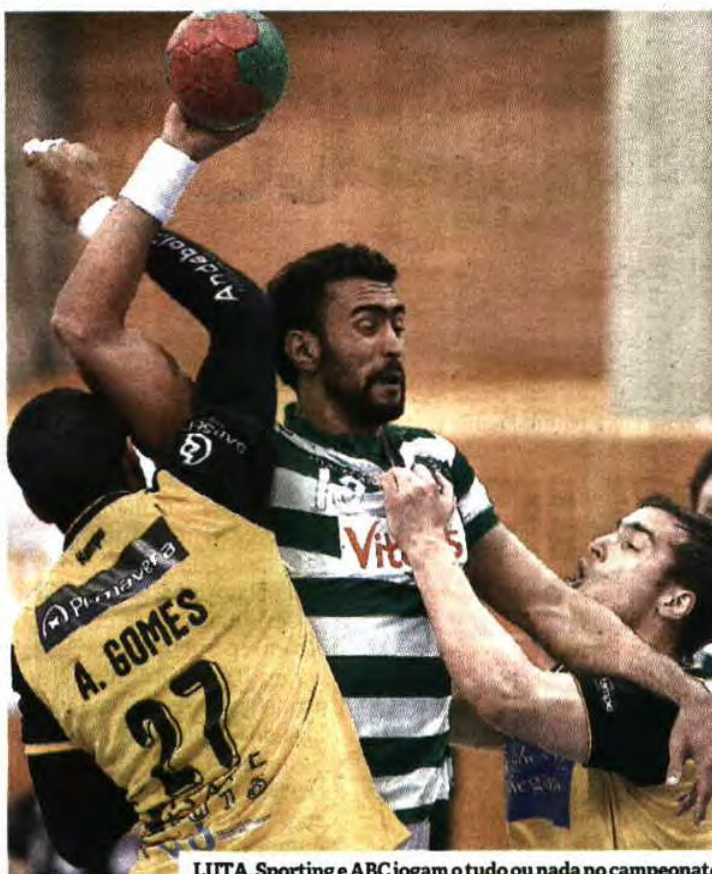
LUTA. Sporting e ABC jogam o tudo ou nada no campeonato