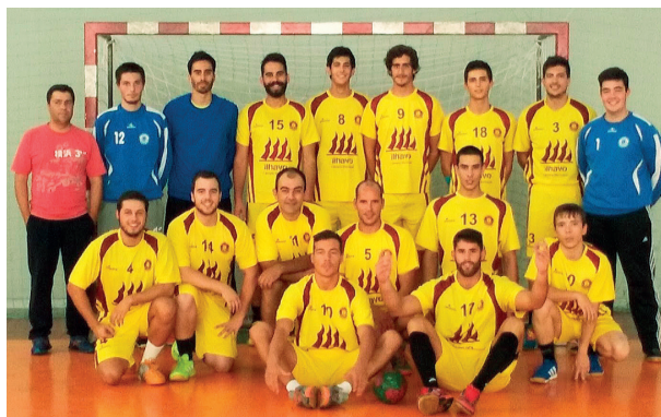
Equipa do Ílhavo AC ainda pode evitar a descida de divisão

A esmagadora maioria dos clubes que participam no Campeonato Nacional da 2.ª Divisão solicitou à Federação de Andebol de Portugal a alteração do modelo competitivo da prova, que na próxima época vai ser disputada em três zonas, cada uma composta por dez equipas. Esta mudança poderá ser benéfica, em primeiro lugar, para o Ílhavo Andebol Clube, que, tendo ficado em último lugar na primeira fase da Zona Sul - em situação normal desceria de divisão -, vai disputar uma liguilha com o terceiro classificado