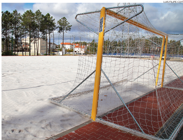
LUIS FILIPE COITO

“O objectivo da construção do campo foi o de criar condições para os jogadores treinarem e jogarem num campo com medidas oficiais. Serve para fomentar o futebol de praia a nível local, mas também potenciar outras modalidades como o andebol e o vo-