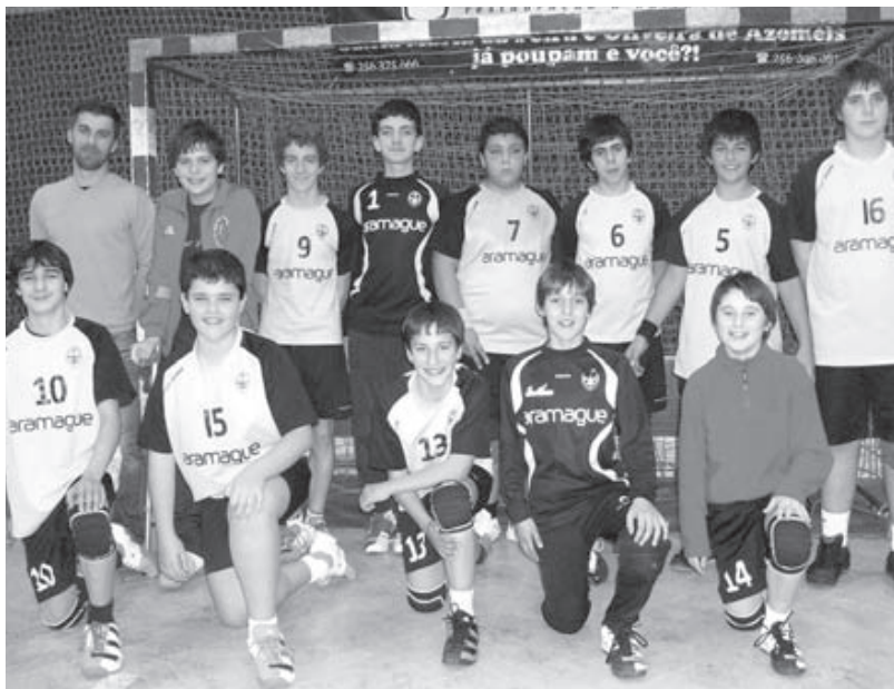
Infantis masculinos da CPVV