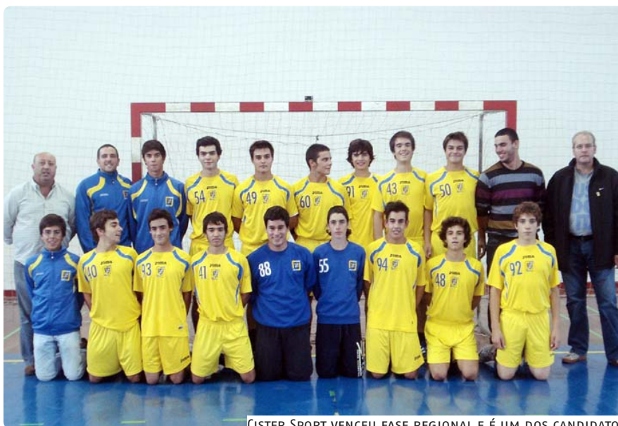
CISTER SPORT VENCEU FASE REGIONAL E É UM DOS CANDIDATOS

Também com presença na fase final do regional estão as infantis do Ext. Dom Fuas, que terminaram a 1ª fase com um triunfo expressivo sobre a CB Castelo Branco (33-15), ocupando o 3º lugar da tabela.