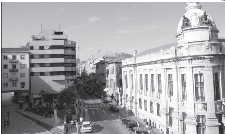
Câmara deverá renovar superfície da Avenida Central e da Rua dos Chãos até final do Verão

Os vereadores são igualmente chamados a aprovar uma nova transferência de 150 mil euros para a Funda-