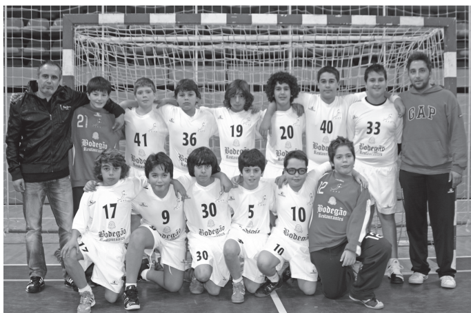
Infantis Clube Andebol da Póvoa

data festiva para mostrar a Taça de Campeões Regionais de Juvenis da época passada, entregando ao mesmo tempo as medalhas respectivas aos atletas.