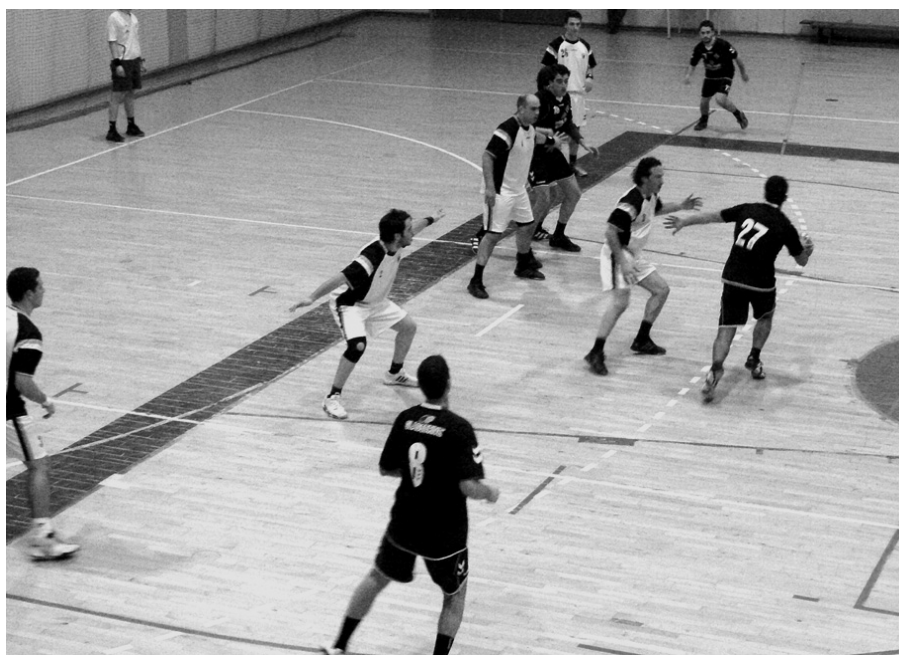
Académico e Académica tiveram que jogar no Pavilhão do Inatel devido ao mau estado do Pavilhão do Fontelo

Em termos de comportamento das equipas da região na jornada, pode dizer-se que o ABC de Nelas deu um bom salto para chegar à fase da manutenção automática e que dá, também, acesso à discussão da