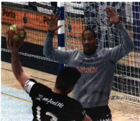
Alfredo Quintana está em grande forma

Alfredo Quintana Guarda-redes do FC Porto