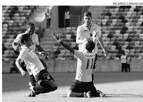
Índio festejou duas vezes na no relvado do Municipal de Aveiro

O Sporting B mandou em todo o primeiro tempo. Wallyson, Iuri Medeiros e Podence jogaram como quiseram e acabaram por chegar ao golo da forma menos prevista: uma escorregadela de Assis, na pequena área, recuperação de bola