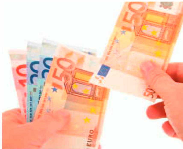
Contratos-programa não significam dinheiro na hora.

Nesse sentido, no Jornal Oficial da Região foi ontem publicada a celebração de mais 34 contratos-programa de desenvolvimento desportivo com associações regionais de modalidades multidesportivas, referente ao primeiro semestre de 2012, entre Janeiro e Junho,