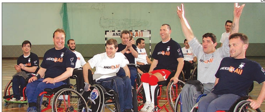
Equipa de andebol da APD Braga

A 4. a concentração de andebol em cadeira de rodas, organizada pela APD Braga e Federação de Andebol de Portugal, com apoio da Associação de Andebol de Braga, disputou-se no passado sábado, no Pavilhão Municipal de Ferreiros, em Braga.