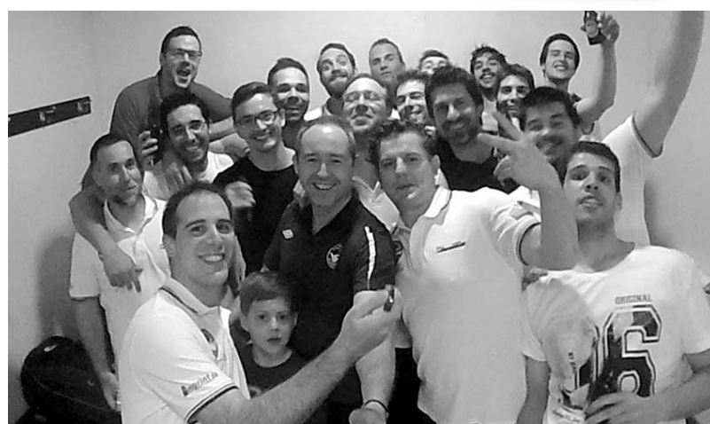
A festa continua em casa, hoje mesmo, pelas 18h, no jogo frente ao Gondomar