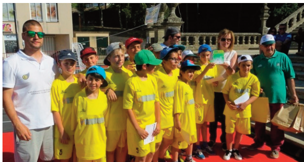
Equipa do Agrupamento de Escolas da Sé

O projecto está inserido no Plano de Desenvolvimento Regional da Federação de Andebol de Portugal e Associação de Andebol de Viseu, com vista à promoção e desenvolvimento da modalidade nas escolas do 1.º Ciclo.