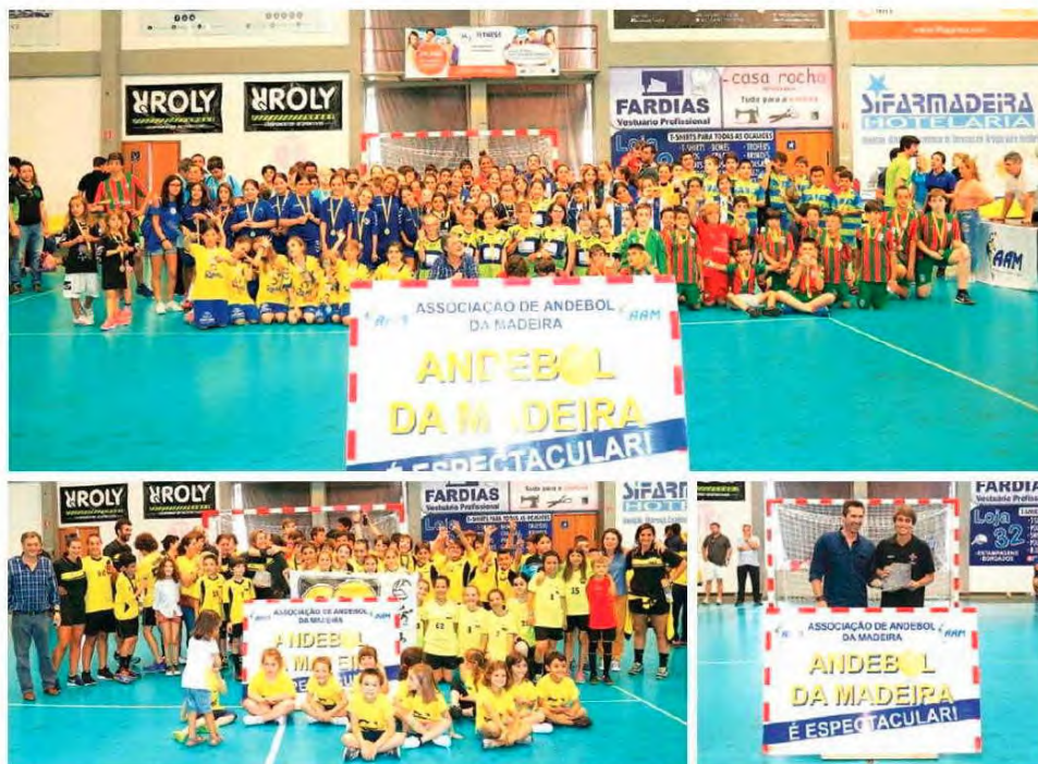
Associação de Andebol da Madeira homenageou os grandes campeões da época 2016/2017.