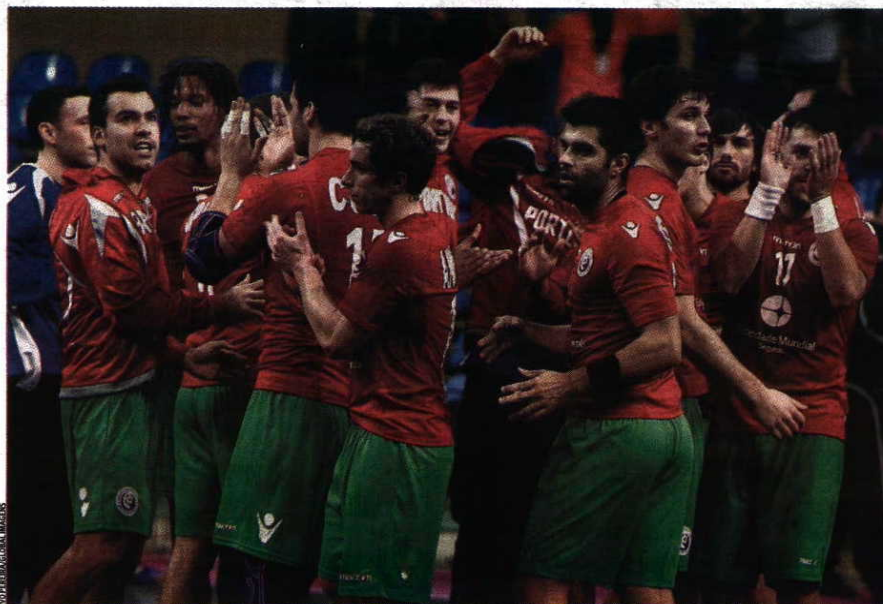
Unidos > Seleção Nacional voltou hoje aos trabalhos e vai atacar os dois jogos com a Suíça